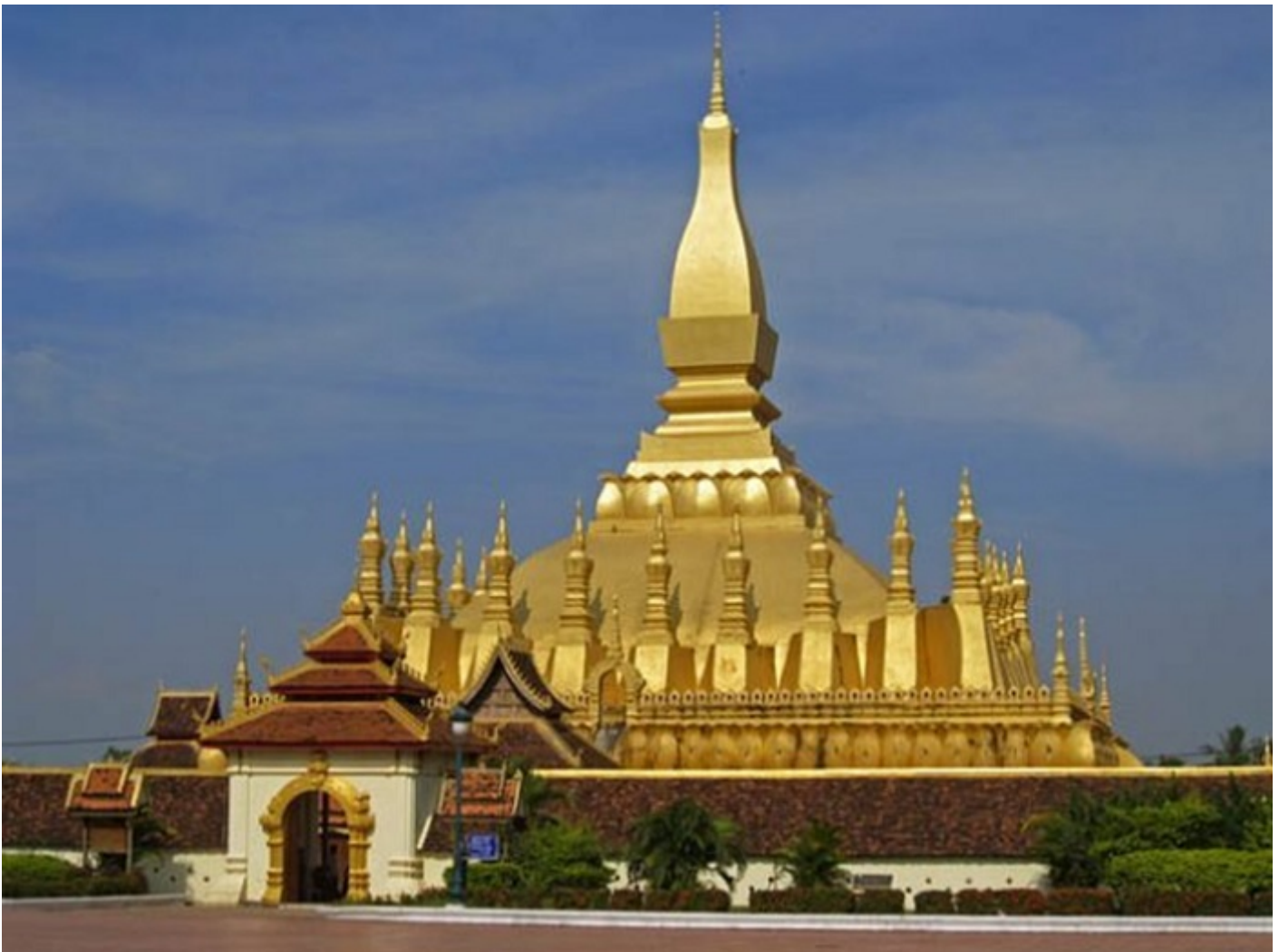
Kiến trúc chùa Lào

Lào là đất nước theo truyền thống Phật giáo, nên trong y phục của người Lào cũng có ít nhiều ảnh hưởng lối mặc của thiền môn. Trước tiên là phải kể đến là chiếc khăn chéo trước ngực của người dân, tiếng Lào gọi là Phạ biêng. Đối với mọi người Lào từ già đến trẻ, nam hay nữ, trong các lễ hội truyền thống hay trong lễ tiệc gia đình, dù với các lễ phục truyền thống hay thường phục đều có chiếc khăn chéo trước ngực.