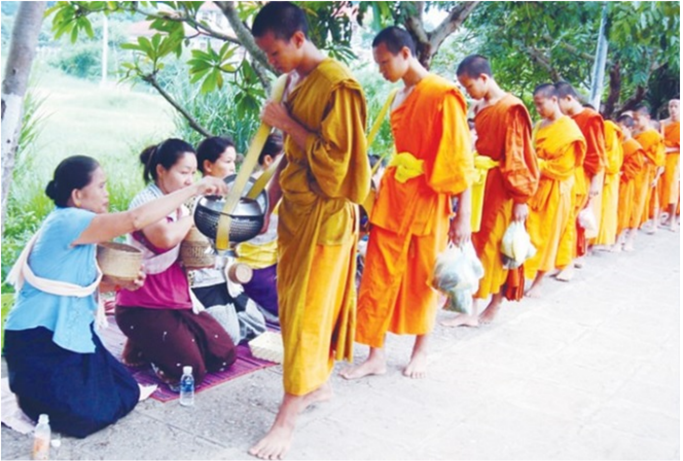
Chư tăng khất thực buổi sáng