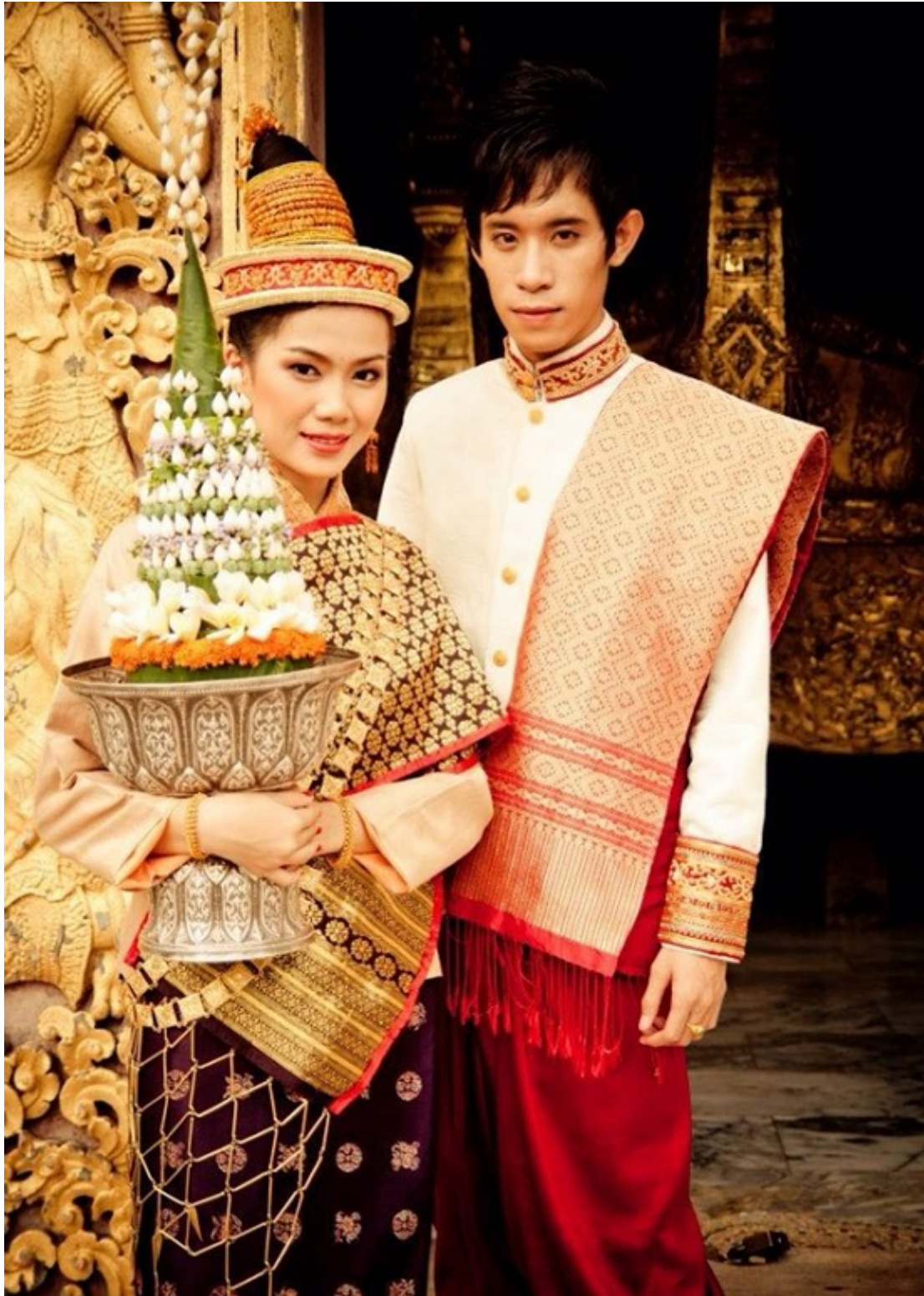
Y phục người Lào

Vì theo truyền thống Nam truyền nên trang phục của tu sĩ Phật giáo Lào không may thành quần áo như Bắc truyền mà chỉ dùng những mảnh vải vàng được quấn lên người.