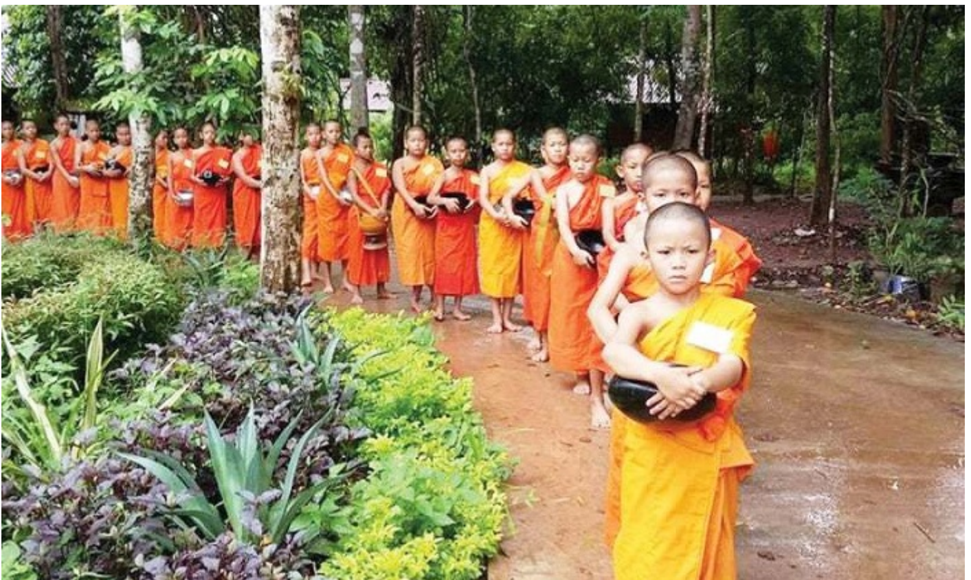
Xuất gia gieo duyên

Khi lên tám, các bé lại được cha mẹ dẫn vào chùa để làm tiểu. Vào chùa, các bé được các sư dạy giáo lý, kinh kệ, dạy chữ, đạo đức làm người và dạy tất cả mọi mặt có thể ảnh hưởng đến cuộc sống sau này như cách ăn mặc, đi đứng, nằm ngồi...Nhà sư luôn luôn kề bên quán xuyến, hướng dẫn, giáo dục cho bé trong sinh hoạt lẫn học tập, lao động trên cơ sở giáo lý nhân đạo của nhà Phật. Sau một thời gian nhất định, bé có thể trở về với gia đình hoặc tiếp tục tu càng tốt.