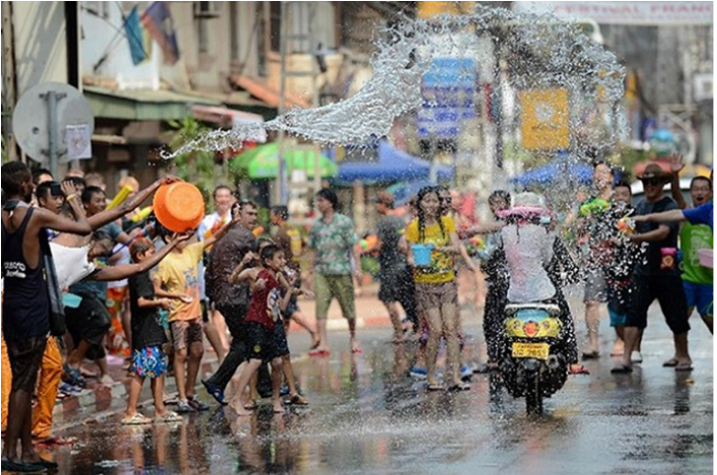
Lễ hội té nước