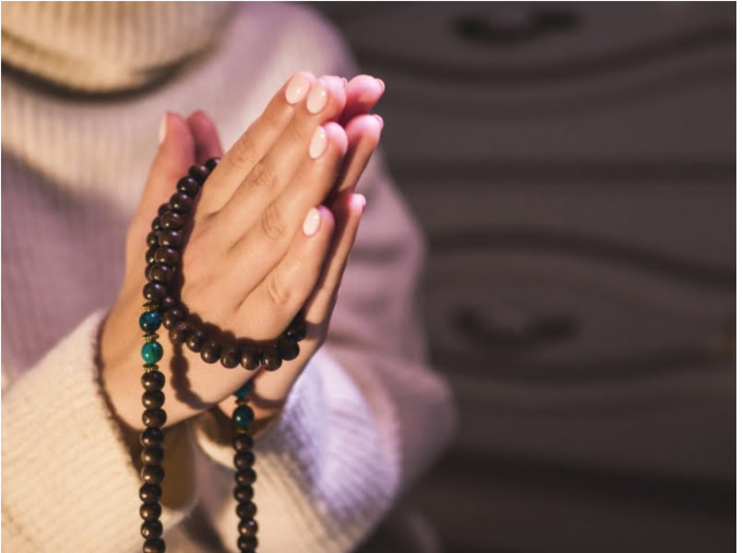
Ảnh mang tính chất minh họa.

Người biết niệm Phật thì tự mình làm chủ lấy mình, gặp sự tức giận buồn rầu đến đâu cũng vẫn tỉnh táo mà đôi phủ, chứ không đến nỗi tối tăm như người khác vậy.