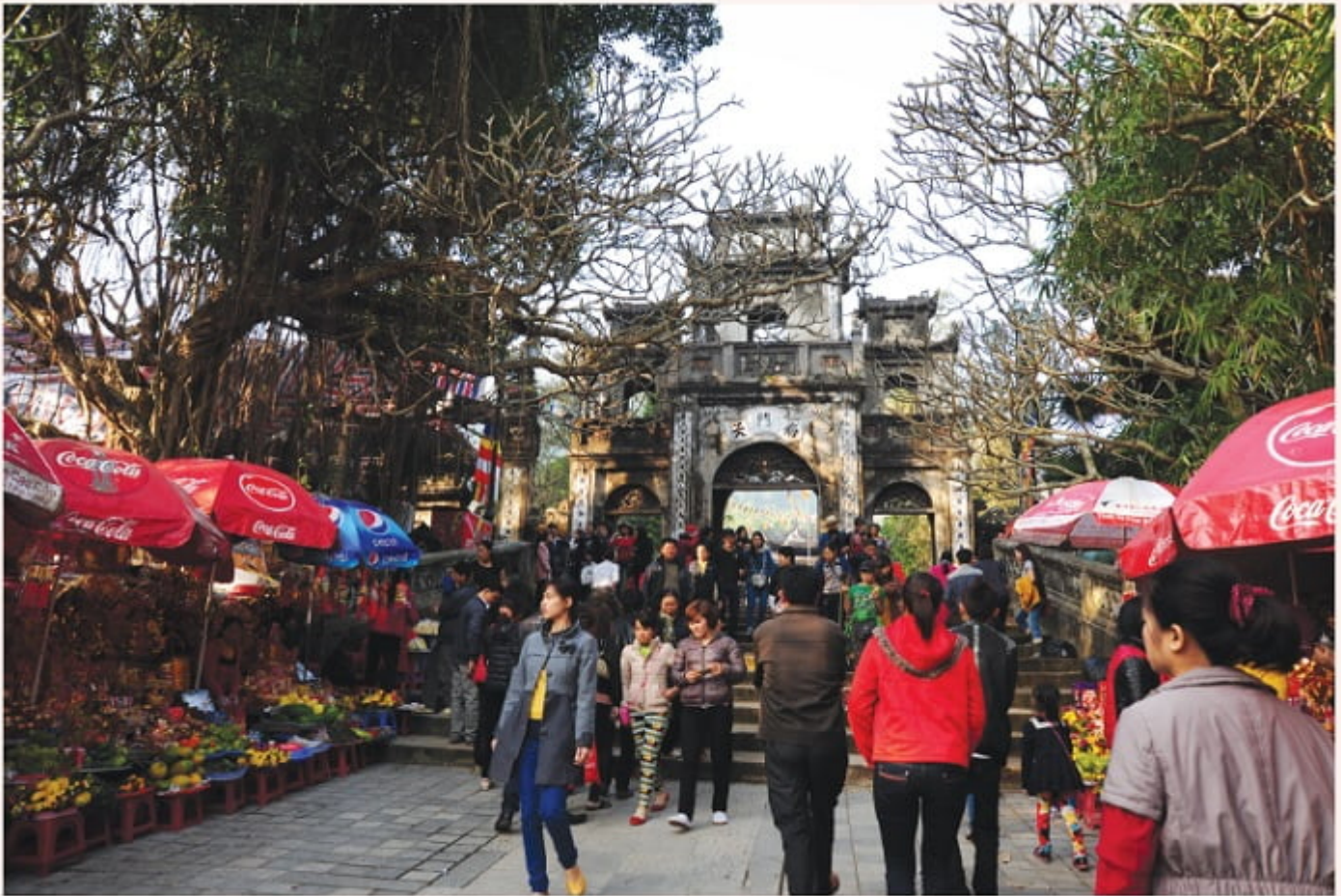
Lễ hội chùa đầu năm- Ảnh: Minh Khang

Hạng người thứ tư: Đáng khen hơn, người này không những thuộc lòng những lời dạy của đức Phật và các bậc thánh nhân, mà còn ứng dụng để thăng hoa cuộc sống. Hạng người này còn hay hơn hạng thứ hai, bởi lẽ người này có thể giúp đỡ dạy bảo, hướng dẫn cho những người khác cùng thực tập pháp. Tùy theo căn cơ trình độ mà người này hướng dẫn. Bởi người này nhớ những lời dạy khác nhau thích nghi với từng hạng người khác nhau.