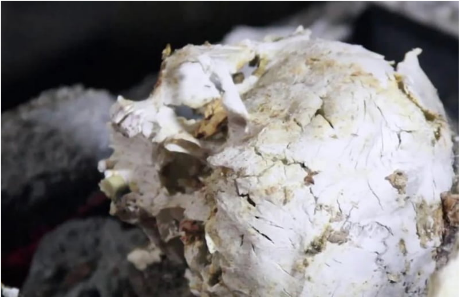
Xá lợi đầu tượng trưng cho trí tuệ của Đại sư Trí Quang.