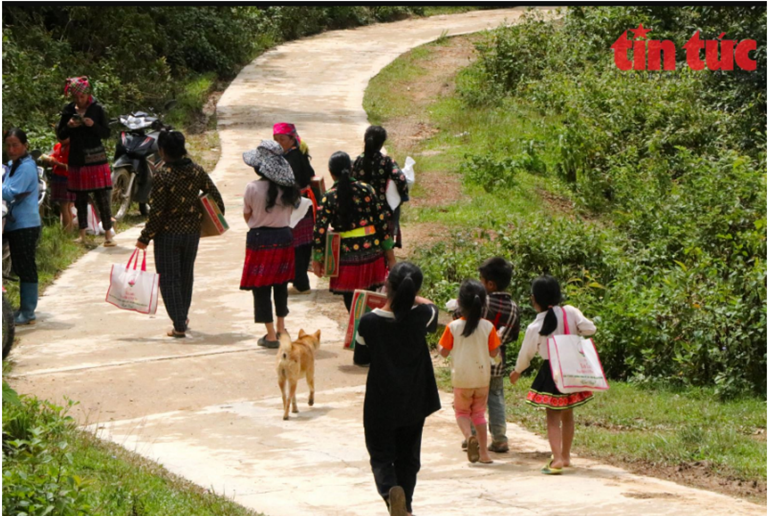
Niềm vui của người dân xã Hua Thanh.

Trước đó, ngày 23/7, Đoàn đã thực hiện Chuyến hành hương “theo dấu chân Chiến sĩ Điện Biên năm xưa”, viếng mộ thắp hương tưởng nhớ các anh hùng liệt sĩ đã nằm lại chiến trường Điện Biên trong những năm kháng chiến chống Pháp khốc liệt. Nhân dịp này, Đoàn đã tặng quà và sổ tiết kiệm cho các Mẹ Việt Nam Anh hùng, người già neo đơn không nơi nương tựa và các mảnh đời đang gặp hoàn cảnh khó khăn trong cuộc sống.