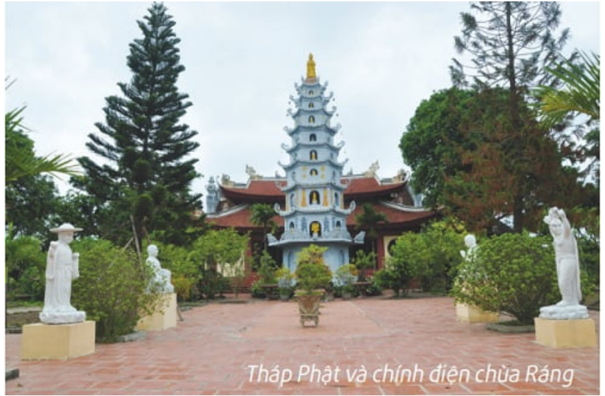
Tháp Phật và chính điện chùa Rạng

Năm 1903, chùa được di chuyển từ bãi sông Hồng về vị trí hiện nay, lập trường giảng đạo cho tăng, ni trong sơn môn, lấy tên là "Viên Minh Pháp Hội", sự kiện trên còn được ghi trong ván kinh để tại chùa.