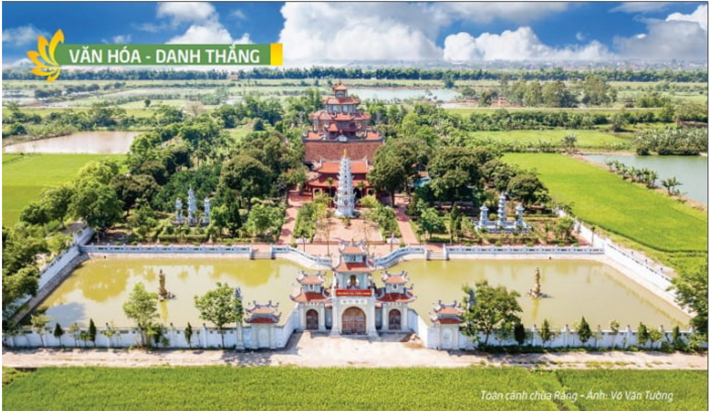
Toàn cảnh chùa Rạng - Ảnh: Võ Văn Tường