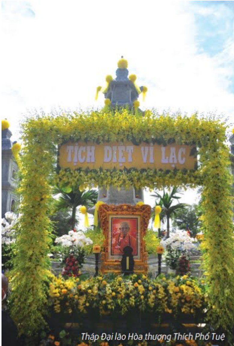
Tháp Đại lão Hòa thượng Thích Phổ Tuệ

Ngôi chùa đó là trụ xứ mà Hòa thượng Thích Phổ Tuệ, đức Đệ tam Pháp chủ HĐCM GHPGVN bậc long tượng pháp khí thiên gia, rường cột cho Phật giáo nước nhà đã tu hành từ lúc xuất gia cho đến lúc Viên tịch về cõi Niết Bàn.