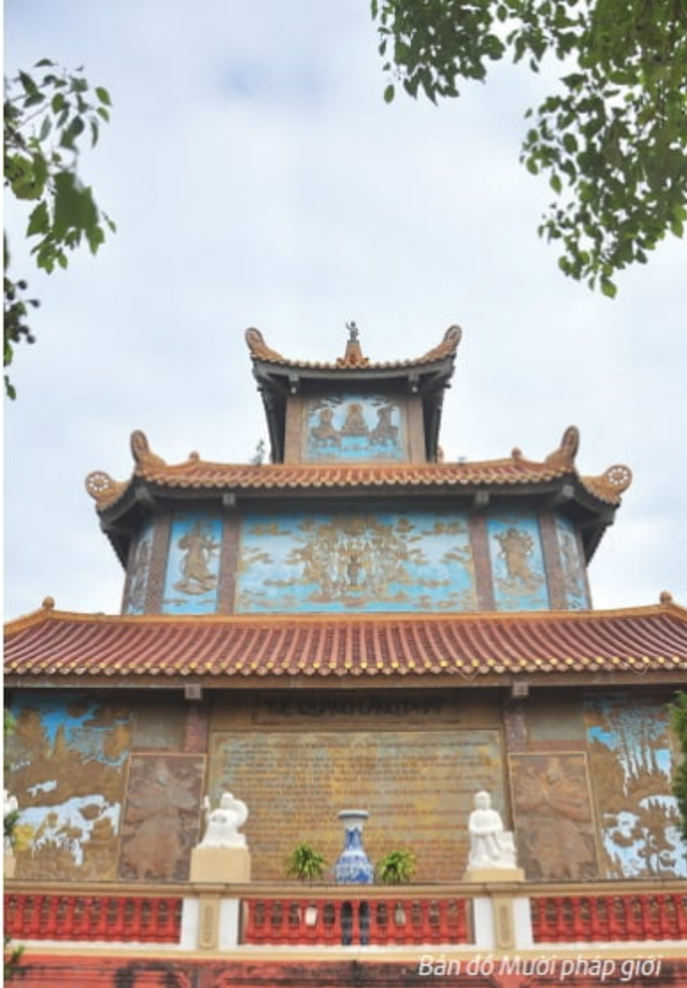
Bàn đồ Mười pháp giới

Trong những năm gần đây, nhà Tổ, thiền Đường và nhiều công trình phụ trợ đã được tôn tạo, xây dựng, mang lại cho khuôn viên chùa với đường đi lối lại sạch sẽ, rợp bóng cây xanh. Các ban thờ tự luôn ngăn nắp, gọn gàng và đặc biệt chùa không có chuyện đặt tiền lẻ, đốt vàng mã hay mâm cao cỗ đầy, chùa không đặt hòm công đức, không cúng - bài, lễ nghi rườm rà. Tất cả vẫn giữ truyền thống của một ngôi chùa quê ở làng quê Phú Xuyên - ngoại thành Hà Nội.