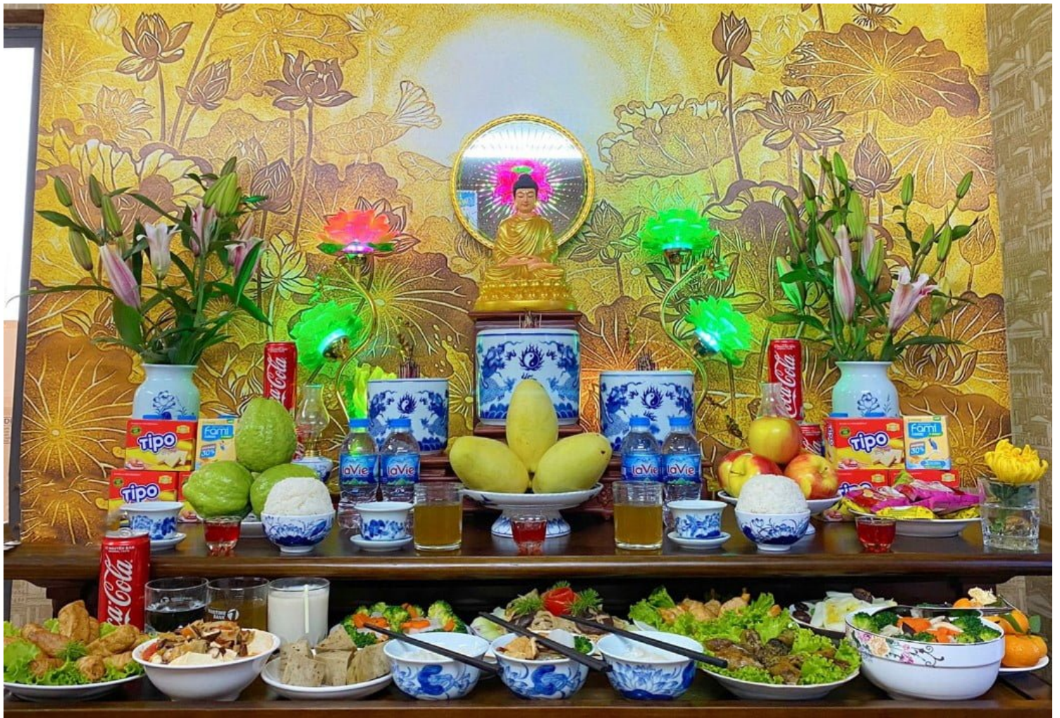
Văn khấn cúng rằm tháng giêng.

Dù cúng bái ra sao thì điều bắt buộc phải có ở mỗi gia đình đó là cúng gia tiên. Việc cúng ngày rằm tháng Giêng là dịp gia chủ bày tỏ lòng thành kính với ông bà, cha mẹ, cảm ơn những người trên đã phù hộ đỡ trì cho gia đình, con cháu được mạnh khỏe, làm ăn phát đạt trong năm.