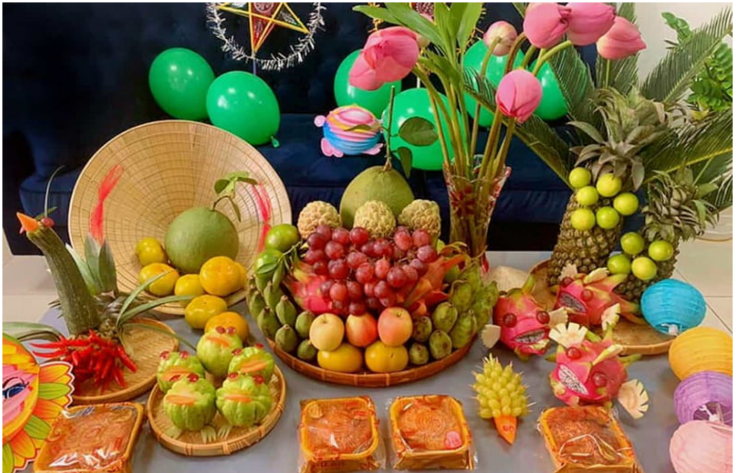
Ảnh minh họa.

Tết Trung Thu là một phong tục rất có ý nghĩa. Nó thể hiện ý nghĩa của chăm sóc, của báo hiếu, của biết ơn, của tình thân hữu, của đoàn tụ, và của tình yêu thương. Cần cố gắng duy trì và phát triển ý nghĩa cao đẹp này.