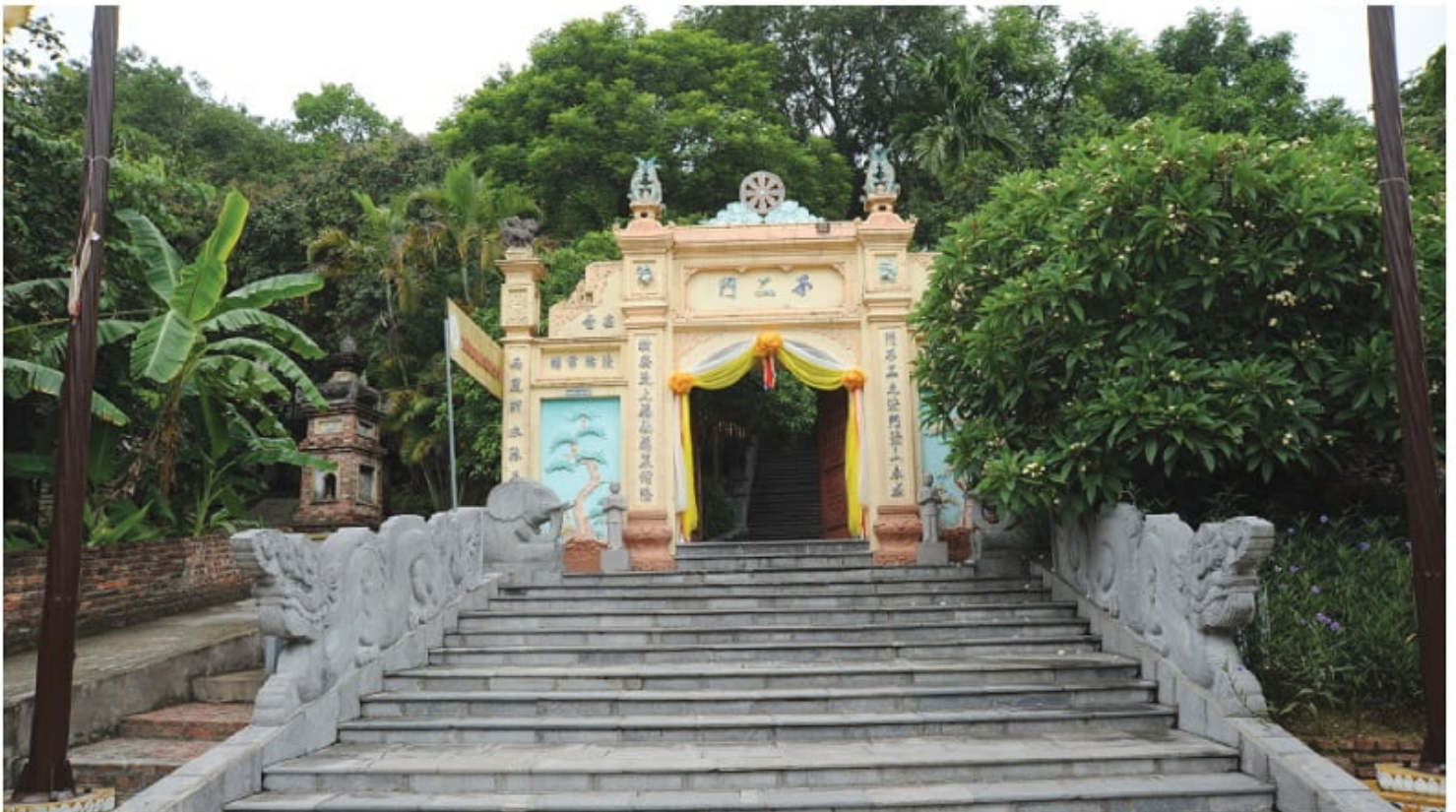
Cổng chùa Tiêu, Tử Sơn, Bắc Ninh

Vua Lê Đại Hành rất tôn kính ngài. Mùa thu năm Canh Thìn 980, tướng Tống là Hầu Nhân Bảo mang quân sang đóng ở gò Tử Cương, núi Giáp Lĩnh, định xâm chiếm nước Đại Cồ Việt. Vua Lê Đại Hành triệu ngài vào hỏi chuyện thắng bại ra sao. Ngài đáp: “Chỉ trong 3, 7 ngày giặc tất phải lui...” Lời nói này về sau đã ứng nghiệm.