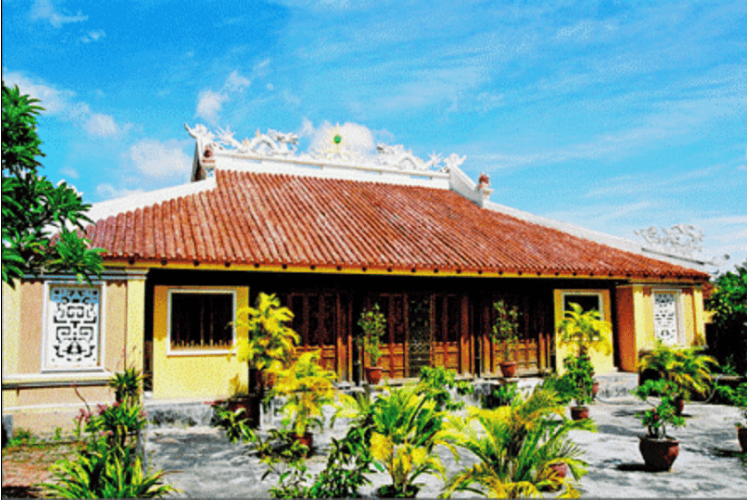
Chùa Thập Tháp, Bình Định.