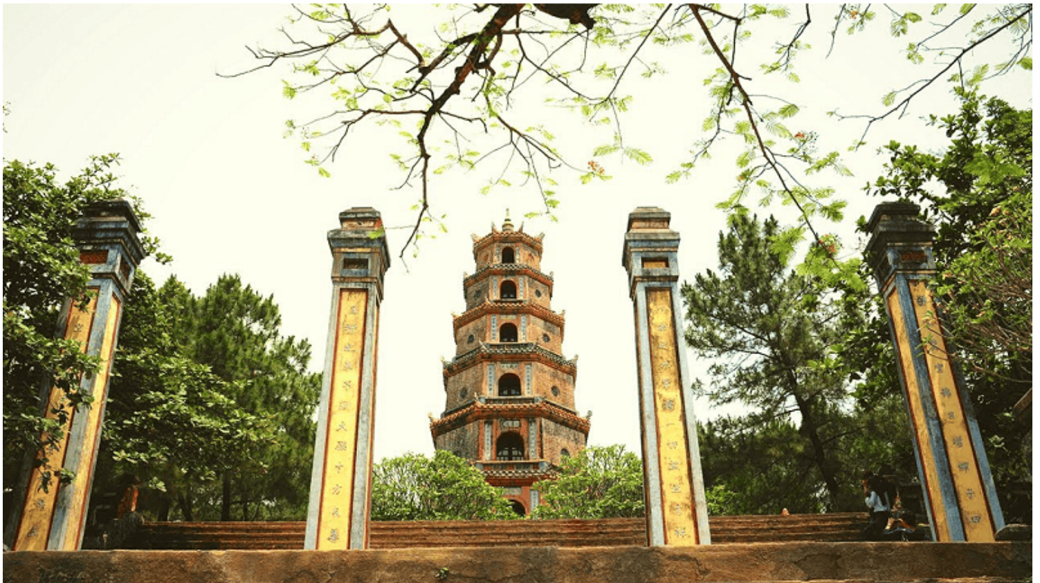
Chùa Thiên Mụ, TT.Huế.

Vào tháng 6 năm ấy, ngài Thạch Liêm đã tổ chức giới đàn Bồ tát giới với 300 tín đồ tại chùa Di Đà. Với một lòng tín Phật trọng tăng chúa đã lập ra hai Ty: Đăng lục và Nội pháp để có thể quản lý trong coi Phật giáo một cách chắc chắn và sâu sát. Vào năm Giáp Ngọ - 1714, chúa đã cho trùng tu lại chùa Thiên Mụ với nhiều hạng mục quan trọng, quy mô hoành tráng. Tiếp đó cử người sang Trung Hoa cầu thỉnh bộ Đại Tạng kinh và được lưu giữ tại Tàng Kinh lâu của chùa Thiên Mụ.