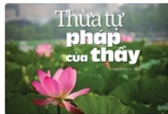
Thừa tự pháp của thầy