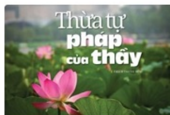
Thừa tự pháp của thầy