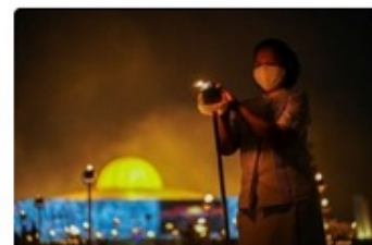
Năm pháp thực hành của cư sĩ: (3) Xa lìa tà hạnh