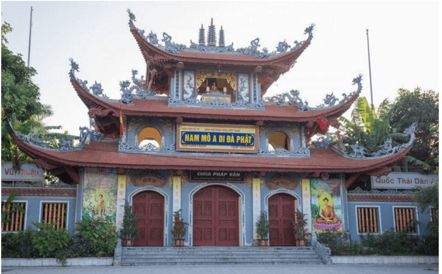
Chùa Pháp Vân - Hà Nội