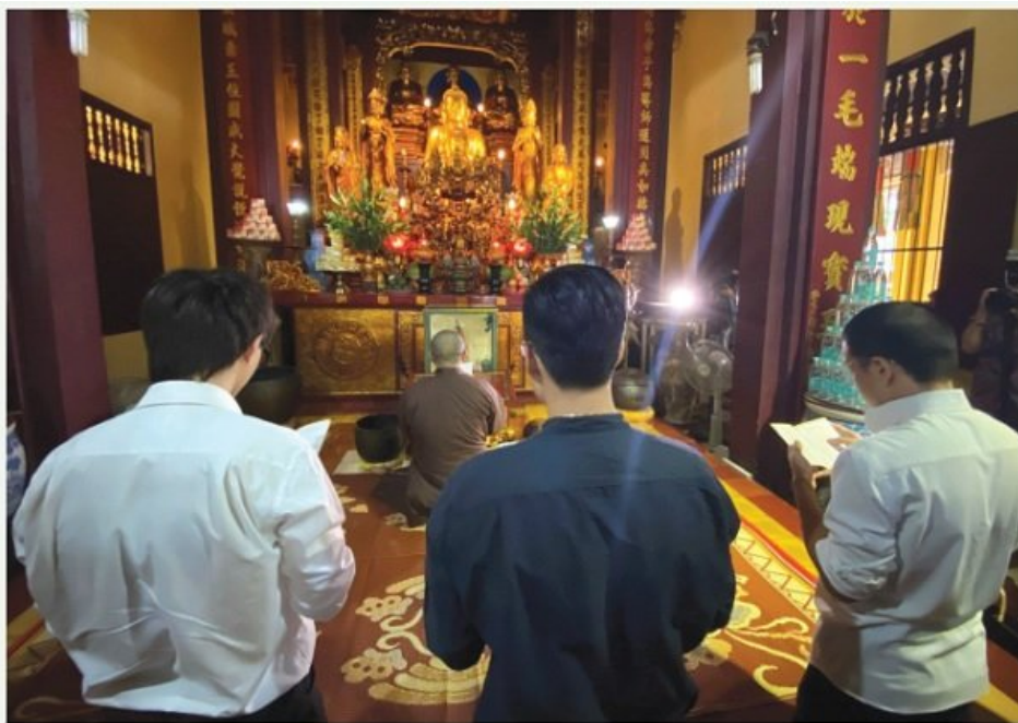
Nhóm tác giả rapper đến sám hối trước điện Phật chùa Quán Sứ Hà Nội.

Vậy ý nghĩa của phương tiện, cũng chính là phương pháp sử dụng đạo lý chân chính và ngôn từ thiện xảo, miễn sao phù hợp với căn cơ của chúng sinh, đều có thể chấp nhận được. Tuy nhiên, nếu chúng ta đứng từ góc độ chân thật của các pháp để giải thích, thì ngay cả những thứ không thuộc về phạm vi của chân thật, đều có thể xây dựng thành chân thật, ấy mới gọi là chân thật. Tất nhiên, những thứ giả tạm vốn không thể gọi là chân thật được, bởi vì nó là mặt trái của giá trị chân thật. Cho nên, mọi người thường hay nói câu: “ phương tiện trong phương tiện ”, là nội hàm của ý nghĩa này. Nghĩa là, tự lợi và lợi tha đã vượt ra ngoài cả phép tắc lẫn giới hạn đang bị ràng buộc. Nên mới nói, khi một hành giả không còn thấy tâm mình trụ vào bất cứ một nơi nào nữa, lúc đó mọi thứ sẽ được hiện rõ ngay trước mắt, không cần tìm chúng ở đâu xa. Có thể hiểu, sở dĩ ta có được khái niệm về ta, là những thứ được tìm thấy hoàn toàn không thuộc về quyền sở hữu của ta. Chỉ có những người trải nghiệm như thế, mới có thể thấu hiểu hết được giá trị của phương tiện là gì đối với mình.