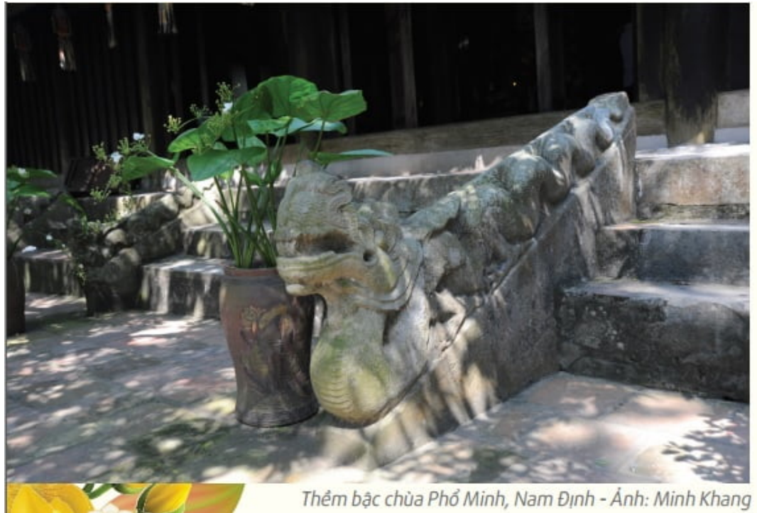
Thềm bậc chùa Phổ Minh, Nam Định

“Một mình giữ một con trâu đất Xỏ mũi lôi theo chẳng chịu rời, Vừa tới Tào Khê buông thả quách Mênh mông nước cuộn quả cầu trôi”(8).