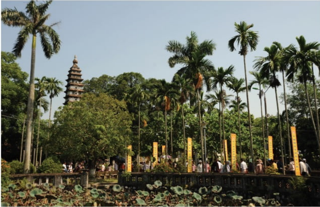
Chùa Phổ Minh, Nam Định

2. Nếu về mặt bản thể luận, Thượng Sĩ giống Trần Thái Tông về cơ bản, thì về mặt nhận thức luận, hai ông đã bắt đầu có sự khác nhau. Ở Trần Thái Tông, từ không khởi vọng (tức vô minh). Vọng xét trên bình diện nhân sinh chính là niệm. Bởi vậy, vấn đề là phải thủ tiêu vọng, niệm và đạt tới vô niệm, tức đạt tới giải thoát (Thùy vô niệm thùy vô sinh). Còn ở Tuệ Trung, từ không (hay vô) xuất hiện huyền hóa (ảo hóa hay vô minh) phân thành nhị kiến. Ông viết: