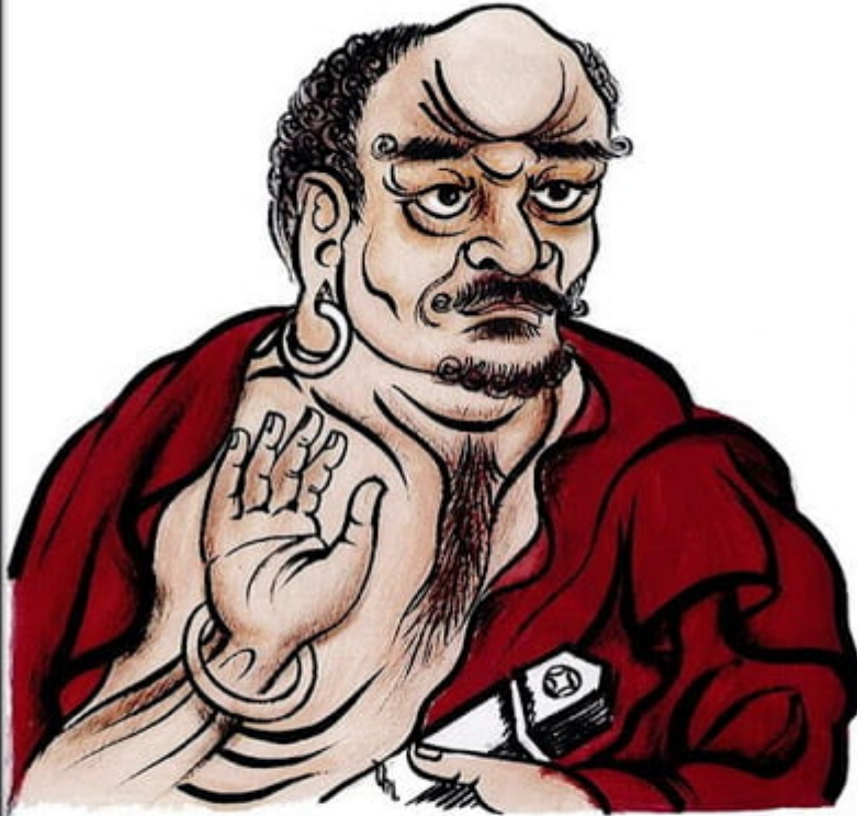
TỔ THỨ 14: TÔN GIẢ LONG THỌ ĐẠI SĨ

Thứ nhất, phái Hữu Bộ căn cứ vào lời dạy trong Kinh A Hàm để đưa ra lập luận phản bác tư tưởng của phái Độc Tử Bộ qua Kinh Ôn Tuyên Lâm Thiên: “Cẩn thận, đừng nghĩ quá khứ. Tương lai cũng chớ mong cầu. Quá khứ đã qua, đã mất. Tương lai chưa đến, còn xa. Hiện tại những gì đang có. Thì nên quán sát suy tư” . Như vậy họ cho rằng quá khứ, vị lai là thật có, quá khứ tu tập như thế này thế kia và tương lai cũng đừng mong cầu, hy vọng nó sẽ như thế này thế kia. Nếu không có quá khứ và tương lai thì không thể có câu nói “tôi biết những việc quá khứ như thế này thế kia” cũng không thể có ý nghĩ “tôi ước mong tương lai như thế này thế kia” và do vậy họ xác định có quá khứ hiện tại và tương lai. Và để tăng thêm sức thuyết phục cho quan điểm của mình, Thuyết Nhất Thiết Hữu Bộ đã lấy dẫn chứng từ kinh Tạp A Hàm: “Này các Tỳ Kheo, sắc quá khứ là vô thường, sắc ở vị lai cũng vô thường. Sắc quá khứ, vị lai vô thường hưởng gì sắc ở hiện tại? do vậy, vị Đa văn Thánh đệ tử không nên luyến tiếc sắc quá khứ, không nên tìm cầu sắc vị lai, đối với sắc vị lai không nên tham luyến”