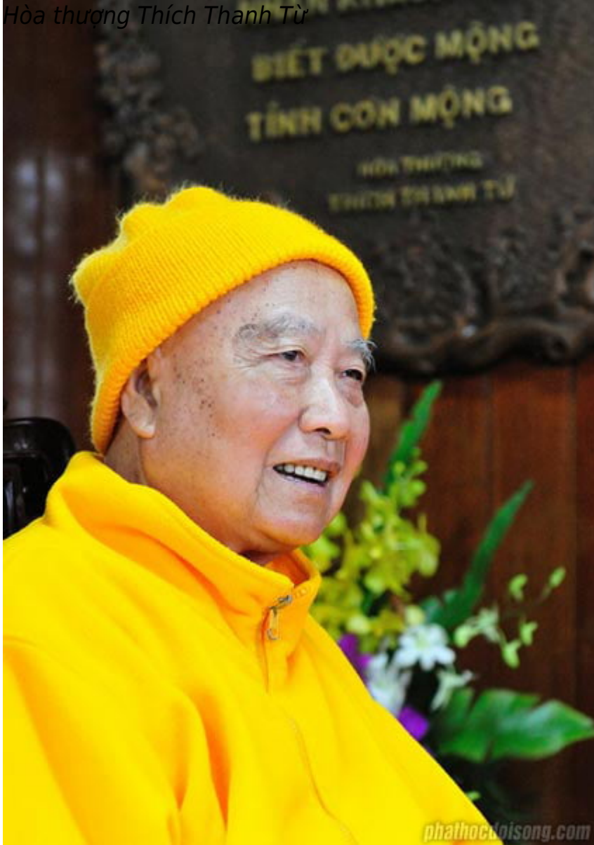
Hòa thượng Thích Thanh Từ

Trong gia đình, nếu mọi người không biết tu thì cứ cãi và chửi bới gây phiền não cho nhau. Thậm chí gây cãi không nguôi còn giận thì đánh đập, đánh đập không thỏa mãn cơn giận thì tình nghĩa không còn, mà tình nghĩa đã hết thì ly dị chia tay, gia đình đổ nát.