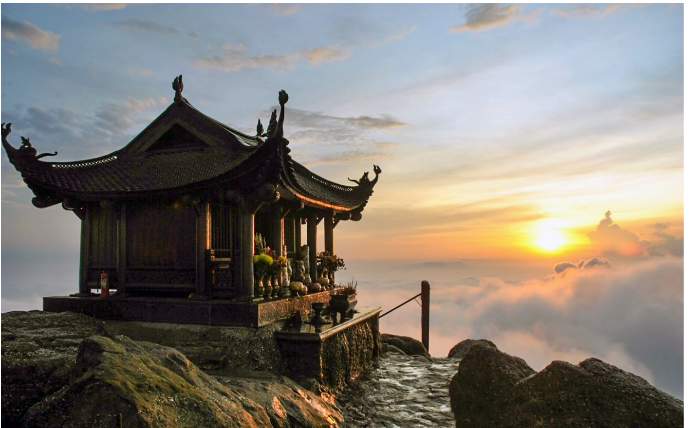
Chùa Đồng, Yên Tử, Quảng Ninh.

Trải qua thời gian trên 700 năm dòng Thiền nhập thế Trúc lâm Yên Tử, hay còn gọi là Như Lai thanh tịnh thiền luôn ẩn chứa những điều vi diệu. Nhân dịp đầu xuân Quý Mão 2023, xin chân thành gửi tới các phật tử và bạn đọc xa gần chùm thơ viết về non thiêng Yên Tử nơi ra đời Thiền phái Trúc Lâm: