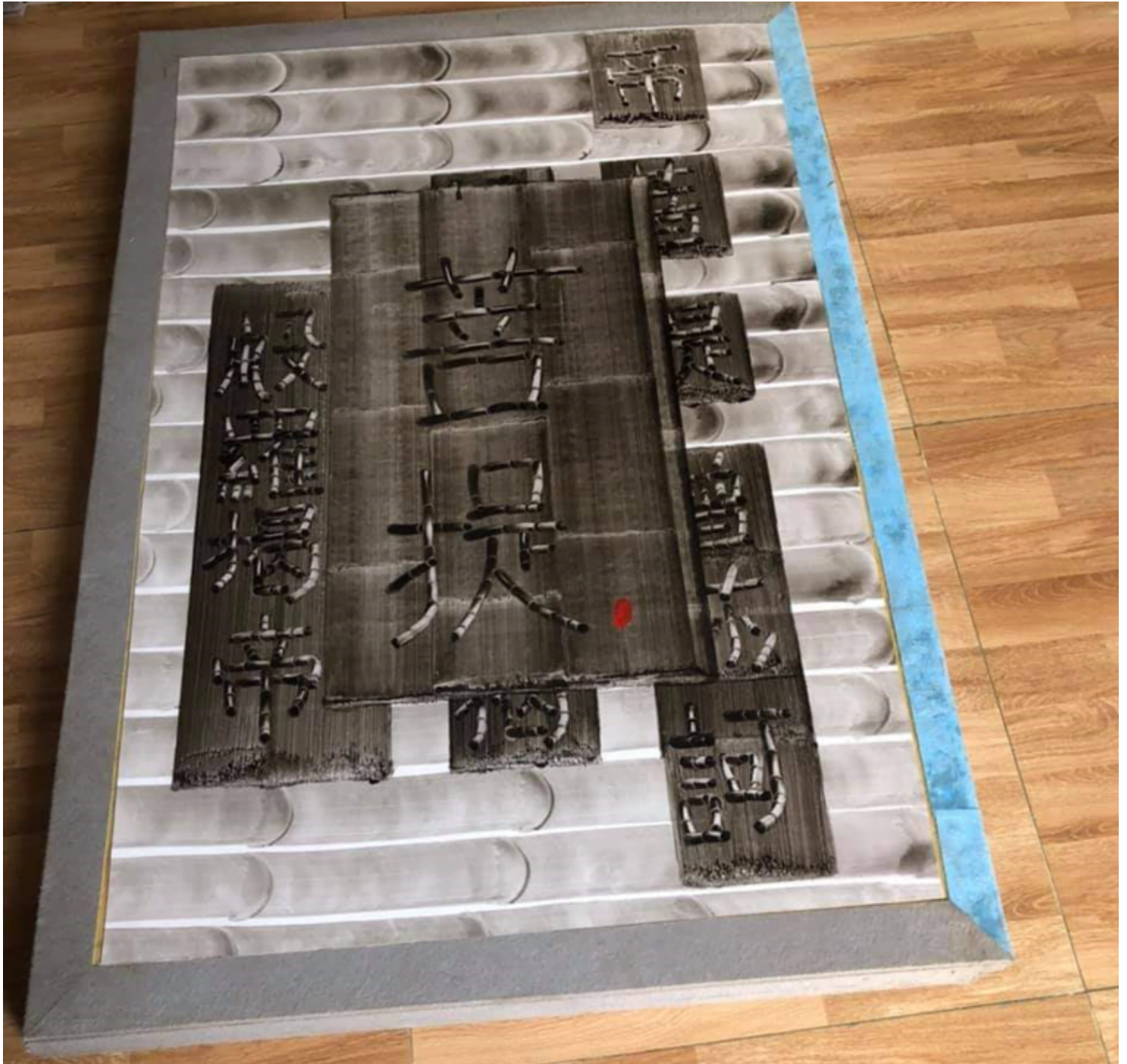
Trang bìa của Tập sách Bát Nhã Tâm Kinh

Một điểm độc đáo nữa, chính là anh đã phá bỏ sự chấp kiến trước kia: chữ chỉ sử dụng cho việc viết, kể cả nghệ thuật thư pháp! Tranh chữ, sao không? Thế là họa sĩ Võ Trịnh Biện chọn ảnh tượng những thân trúc để tạo hình các Hán tự trong không gian 3 chiều, đặt cạnh màu nền tôn chữ là hình ảnh những thân tre sống động như thực.