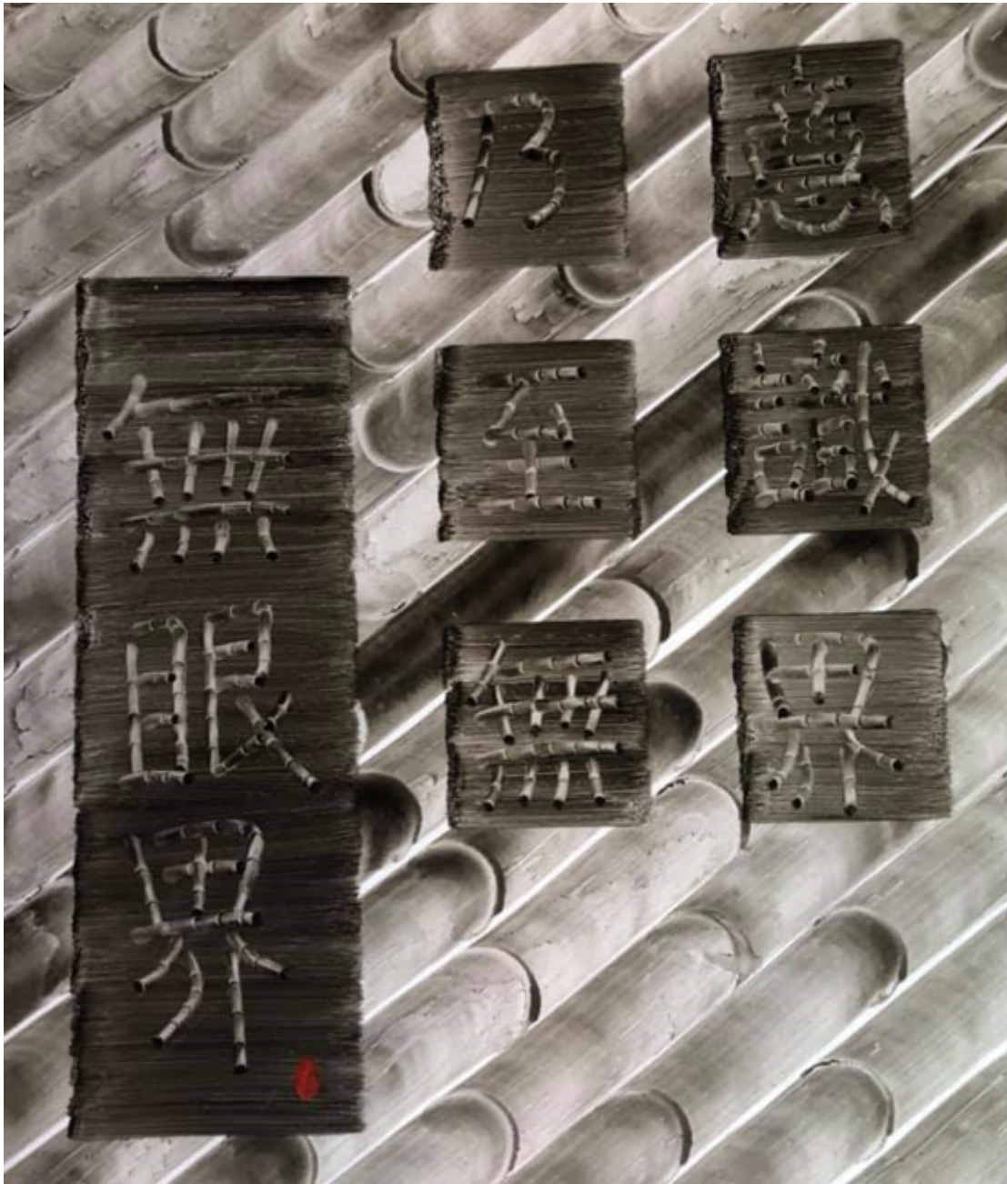
Một trang khác bên trong Tập sách Bát Nhã Tâm Kinh

sáng tối linh động nhằm tô đậm sự uyển chuyển, mềm mại của từng cấu trúc chữ.