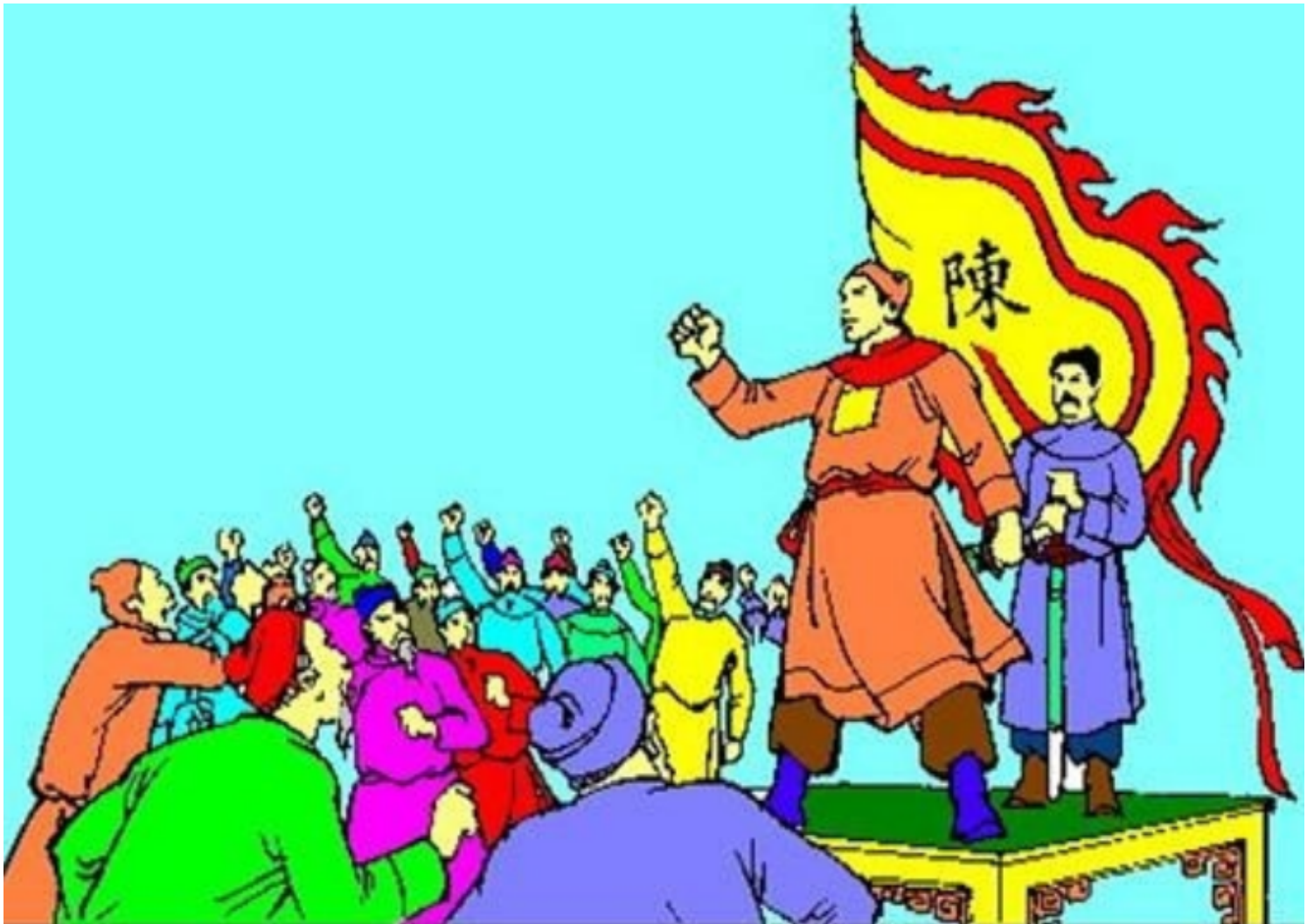
Hình ảnh chỉ mang tính chất minh họa.

Tuy nhiên, đứng trước sự lựa chọn giữa cuộc sống thế tục, công danh, sự nghiệp, hạnh phúc gia đình, duy trì nòi giống và xuất gia học đạo, tu hành, sống cuộc đời thiếu thốn, buông bỏ sự xa hoa, ẩn cư nơi núi rừng...là một vấn đề không dễ chọn lựa trong suy nghĩ của mọi người.