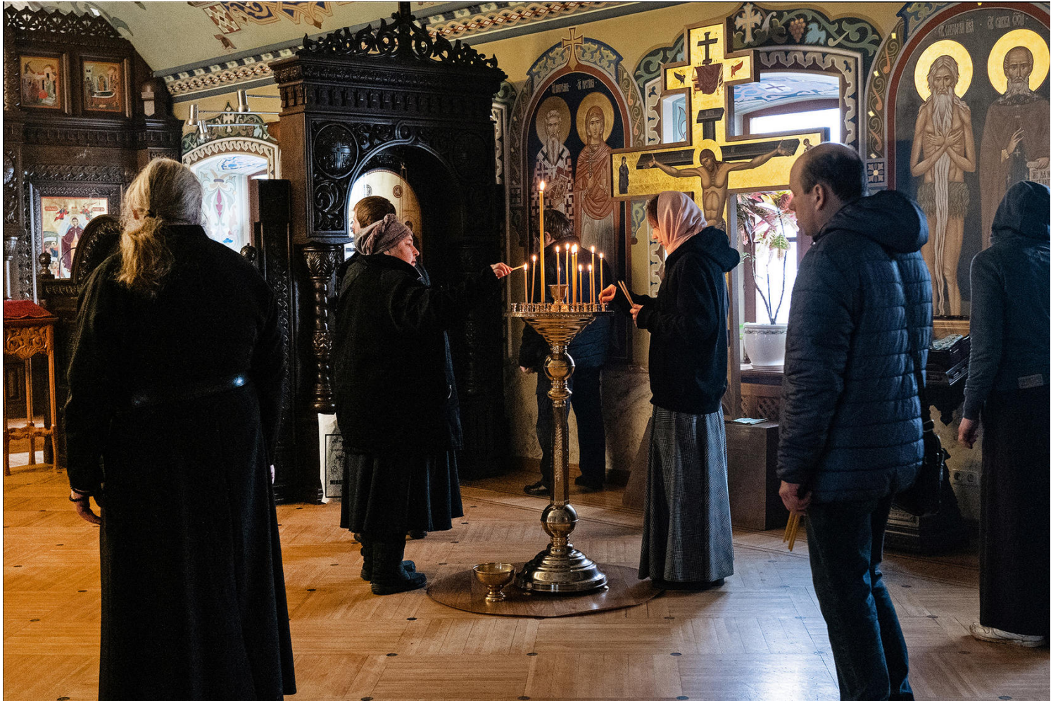
Những người làm việc tại Tu viện các hang động Kyiv là một tu viện Thiên Chúa Chính thống giáo Đông phương lịch sử nằm tại huyện Pechersk, Ukraine. Ngày 0/03/2022.