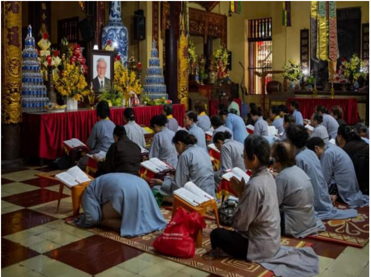
Ảnh: Các Phật tử tụng kinh tưởng niệm trước Di ảnh Tổng Bí thư Nguyễn Phú Trọng tại chùa Quán Sứ - Trụ sở Giáo hội Phật giáo Việt Nam.

Ngay sau khi biết tin Tổng Bí thư Nguyễn Phú Trọng từ trần, nhiều cơ sở tín ngưỡng, tôn giáo trong và ngoài nước đồng loạt tổ chức lễ cầu nguyện cho hương hồn cố Tổng Bí thư Nguyễn Phú Trọng, anh linh Tổng Bí thư luôn sống mãi trong trái tim dân tộc Việt Nam.