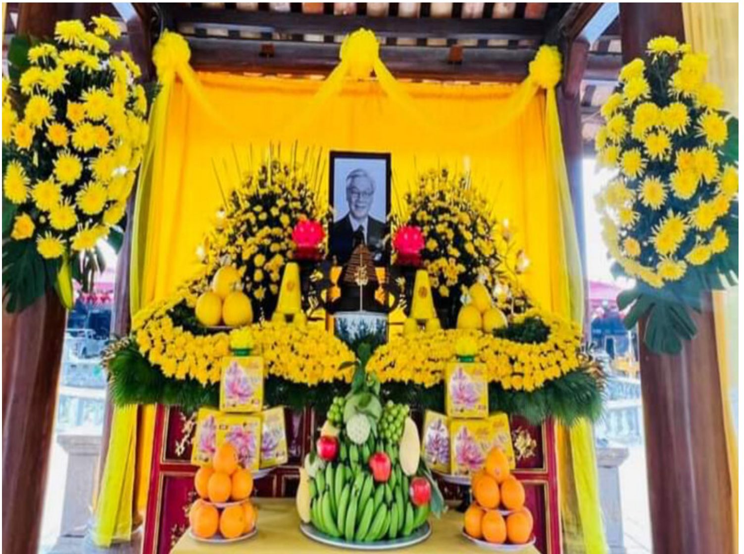
Ảnh: Ban thờ tưởng niệm Tổng Bí thư Nguyễn Phú Trọng tại Khu Di tích Quốc gia Phủ Chính, Phủ Dầy Nam Định.

Mỗi tôn giáo ở Việt Nam dù có đức tin, hệ thống giáo lý, giáo luật khác nhau, nhưng cùng có điểm tương đồng ở tinh thần dân tộc, trong phương châm sống “tốt đời, đẹp đạo”. Các tổ chức tôn giáo là cầu nối giữa Đảng, Nhà nước với chức sắc, tín đồ trong công cuộc xây dựng và phát triển đất nước, đồng bào các tôn giáo là bộ phận của khối đại đoàn kết toàn dân tộc.