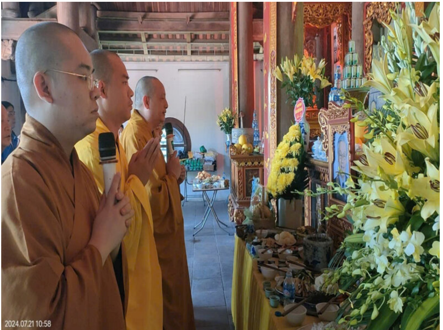
Ảnh: Giáo hội Phật giáo Việt Nam thành phố Hải Phòng tổ chức lễ tưởng niệm Tổng Bí thư Nguyễn Phú Trọng tại Đền thờ Chủ tịch nước Tôn Đức Thắng huyện Tiên Lãng.

Luật Tín ngưỡng, tôn giáo cũng cụ thể hóa những quy định của Hiến pháp 2013 về quyền con người, quyền công dân liên quan đến quyền tự do tín ngưỡng, tôn giáo của mọi người. Những nội dung mới của Luật Tín ngưỡng, tôn giáo cũng được bổ sung để tạo sự tương thích với luật pháp quốc tế trong bối cảnh Việt Nam hội nhập sâu rộng với quốc tế, ký kết và thi hành nhiều hiệp định. Việt Nam bác bỏ những nhận định không khách quan, mang tính định kiến và không chính xác về tình hình thực tế tại Việt Nam được nêu trong Báo cáo tự do tôn giáo quốc tế năm 2024 của Ủy ban Tự do Tôn giáo Quốc tế Hoa Kỳ.