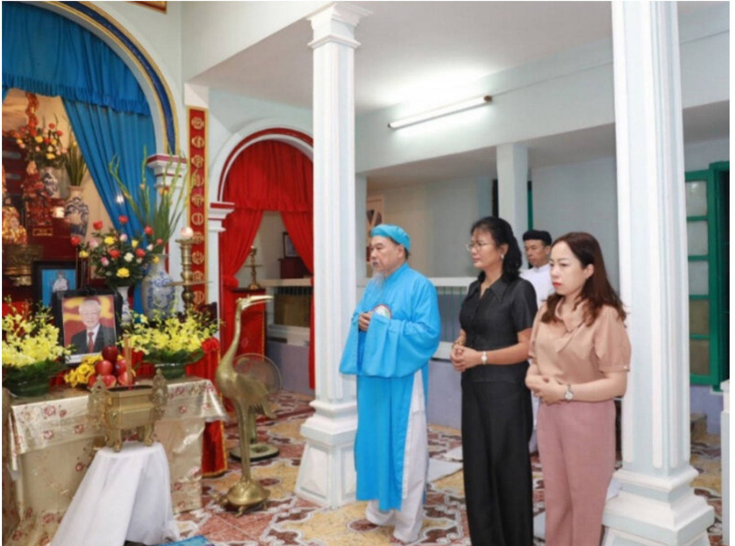
Ảnh: Thánh thất Cao Đài Hà Nội làm lễ cầu nguyện cho Tổng Bí thư Nguyễn Phú Trọng.

Hưởng ứng lời kêu gọi của Tổng Bí thư, Chủ tịch nước Nguyễn Phú Trọng, ngay trong lễ phát động toàn dân tham gia hiến máu tình nguyện của Ban Thường trực Ủy ban Trung ương MTTQ Việt Nam chiều ngày 13/4/2020 đã có 65 chức sắc, chức việc, tín hữu của 07 tổ chức tôn giáo trên địa bàn thành phố Hà Nội đến trụ sở Ủy ban MTTQ Việt Nam Thành phố hiến 56 đơn vị máu để cứu, chữa những bệnh nhân mắc dịch bệnh Covid-19.