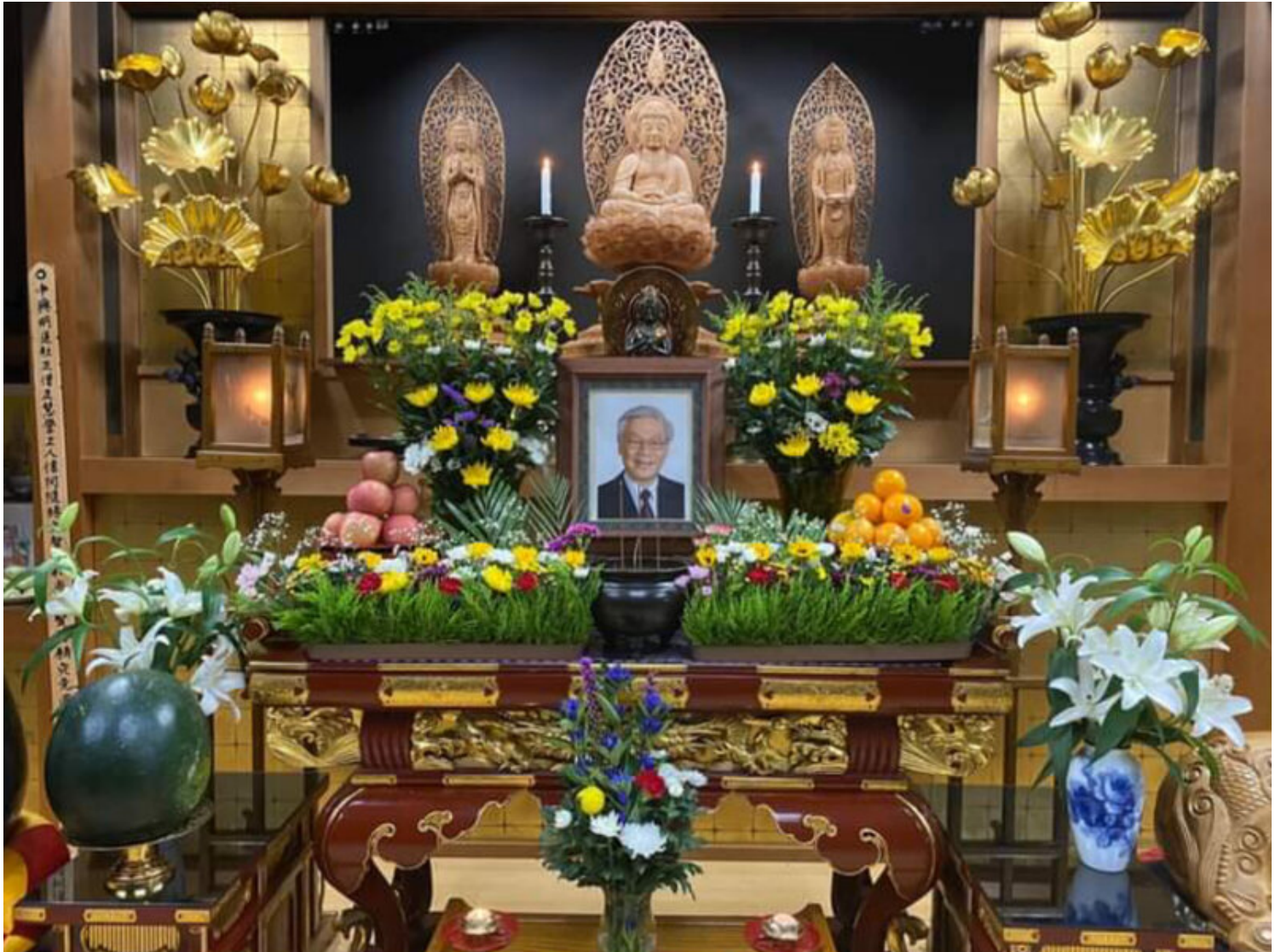
Ảnh: Di ảnh tưởng niệm Tổng Bí thư Nguyễn Phú Trọng tại chùa Đại Ân Tokyo Nhật Bản.

Với tầm nhìn chiến lược và sự quan tâm sâu sắc, trong suốt sự nghiệp hoạt động chính trị của mình Tổng Bí thư Nguyễn Phú Trọng đã có đóng góp to lớn đối với sự phát triển bền vững của các tôn giáo. Những chính sách và di sản của Tổng Bí thư để lại sẽ không chỉ góp phần nâng cao đời sống vật chất và tinh thần của nhân dân mà còn thúc đẩy sự phát triển chung của đất nước.