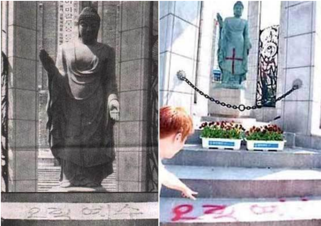
Cơ đốc Nhân Ngông Cuồng đã Dùng Sơn đỏ Vẽ Thánh Giá Và Vẽ Bậy Lên Tượng Phật ở Đại Học Dongguk