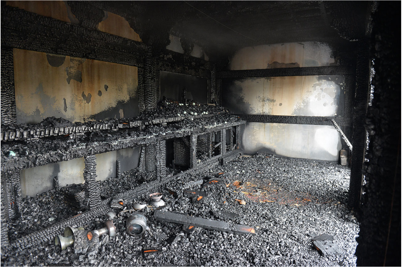
Cơ đốc Nhân Cực đoàn Ngông Cuồng, đã Phóng Hỏa đốt Cháy Ngôi Thiên Ma San Tu Tiến Tự

đã cảnh báo và yêu cầu hủy bỏ buổi nhóm họp của Thánh hội Phật giáo Phục hưng, yêu cầu kiểm chế những biểu hiện có thể dẫn đến mâu thuẫn gay gắt, xung đột giữa các tôn giáo trong cộng đồng Phật giáo.