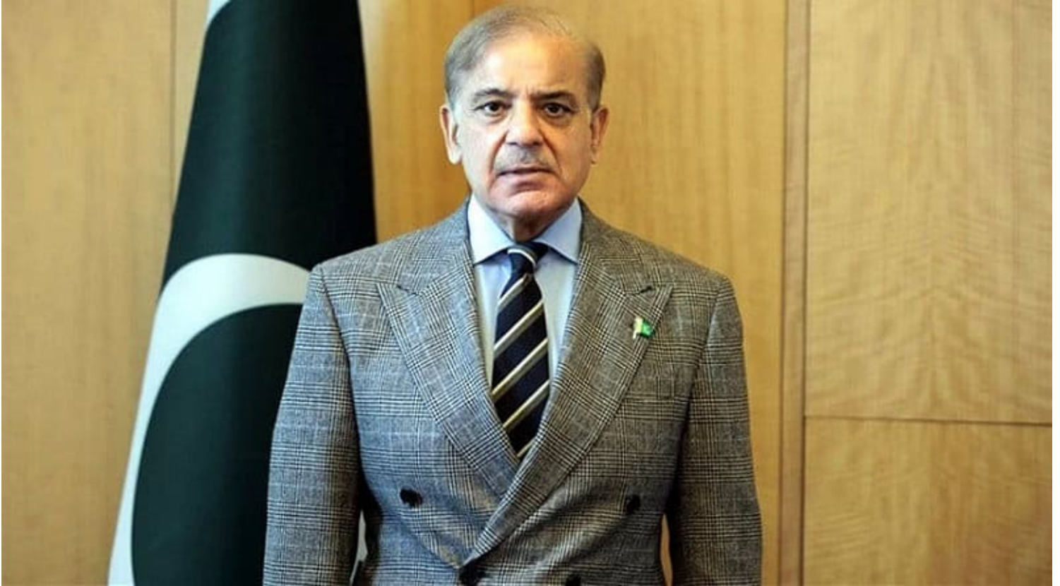
Thủ tướng Chính phủ Cộng hòa Hồi giáo Shehbaz Sharif

Vesak, chúng tôi chân thành gửi lời chúc nồng nhiệt đến quý đạo hữu phật tử trên toàn thế giới. Nguyên cầu ngày trọng đại thiêng liêng này mang lại hòa bình, thịnh vượng và hòa hợp cho tất cả nhân loại. Hãy tôn vinh di sản chung của chúng ta và tiếp tục nỗ lực hướng đến sự tôn trọng và sự hiểu biết lẫn nhau”.