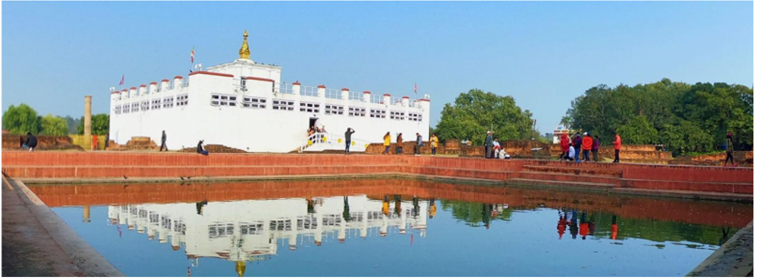
Lumbini, Nepal.

Tổng thư ký Liên Hợp Quốc António Guterres