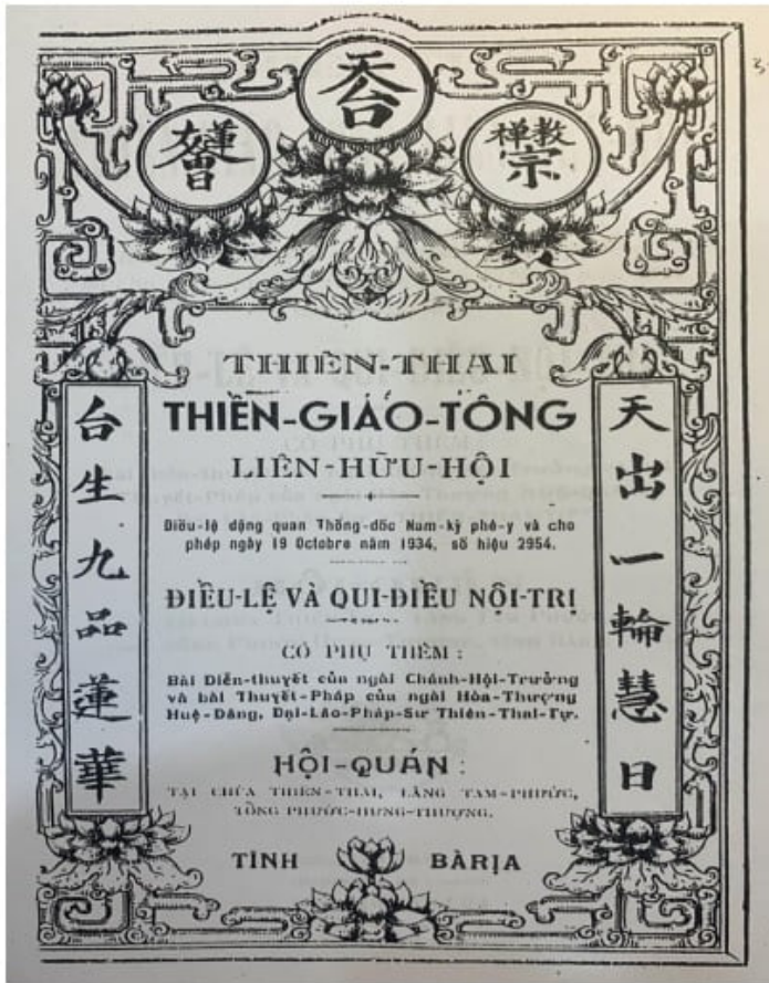
Thiên Thai Thiên giáo tông Liên Hữu hội