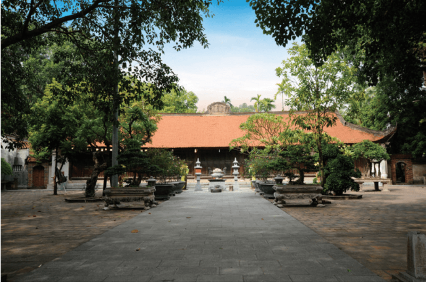
Chùa Vĩnh Nghiêm (Bắc Giang)

Lý do thứ năm , sau này vào đời Lê, người viết sử là các nhà Nho vốn không có cảm tình với Phật giáo, nên những việc hay của đạo Phật nhưng không liên hệ tới triều đình, các nhà viết sử không ghi. Vì thế từ cuối đời Trần đến đời Hồ, thời Minh thuộc, đời Lê tuy cũng có nhiều việc rất hay trong Phật pháp nhưng không được ghi lại nên thời gian đó xem như không có sự liên hệ trước sau. Thế nên sử sách thời Lê đối với Phật giáo rất là thiếu.