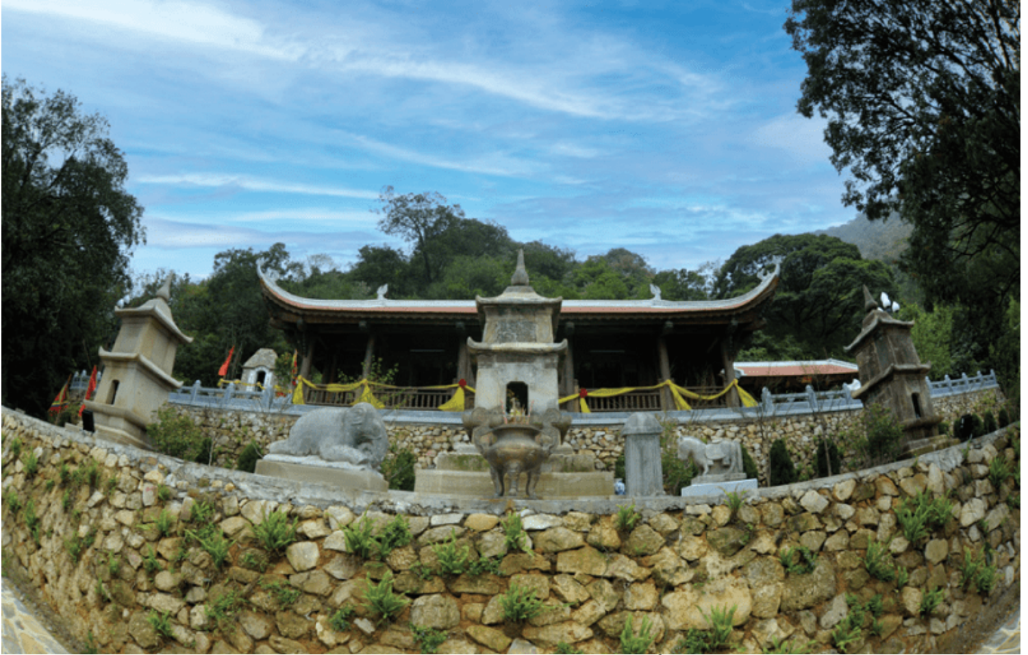
Chùa Am Ngọa Vân (Yên Tử, Quảng Ninh)