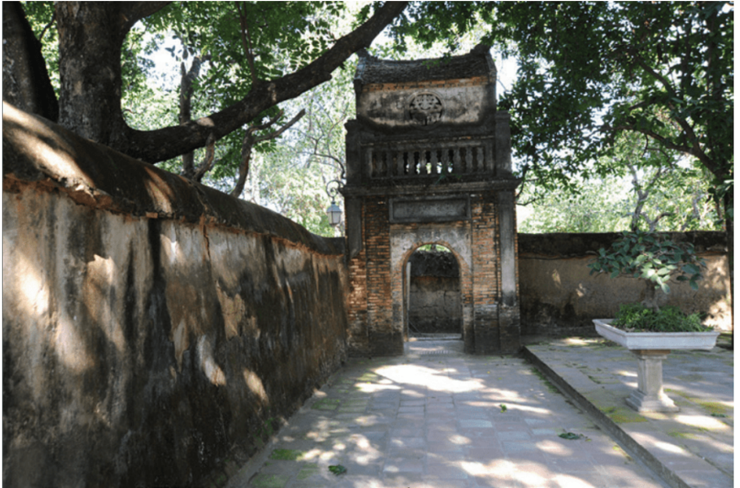
Chùa Bồ Đà (Bắc Giang)

Trong đau khổ cùng cực, người ta bắt đầu quay về với đạo Phật, một đạo lấy đức từ bi là gốc và kỹ thuật trị thế là chủ yếu. Các Chúa Trịnh cũng như các Chúa Nguyễn, không phải là những người học Phật thâm uyên và có ý chí tu học như các vua Trần, nhưng đã quy hướng về đạo Phật, lấy đó làm nơi nương tựa tinh thần. Họ chỉ là những tín đồ Phật Giáo, lấy sự ủng hộ Phật Giáo để tạo dựng công đức cho dòng họ chứ không biết áp dụng Phật Giáo vào việc dựng nước. Tuy vậy, đó cũng là một trong những nguyên nhân đưa tới sự phục hưng.