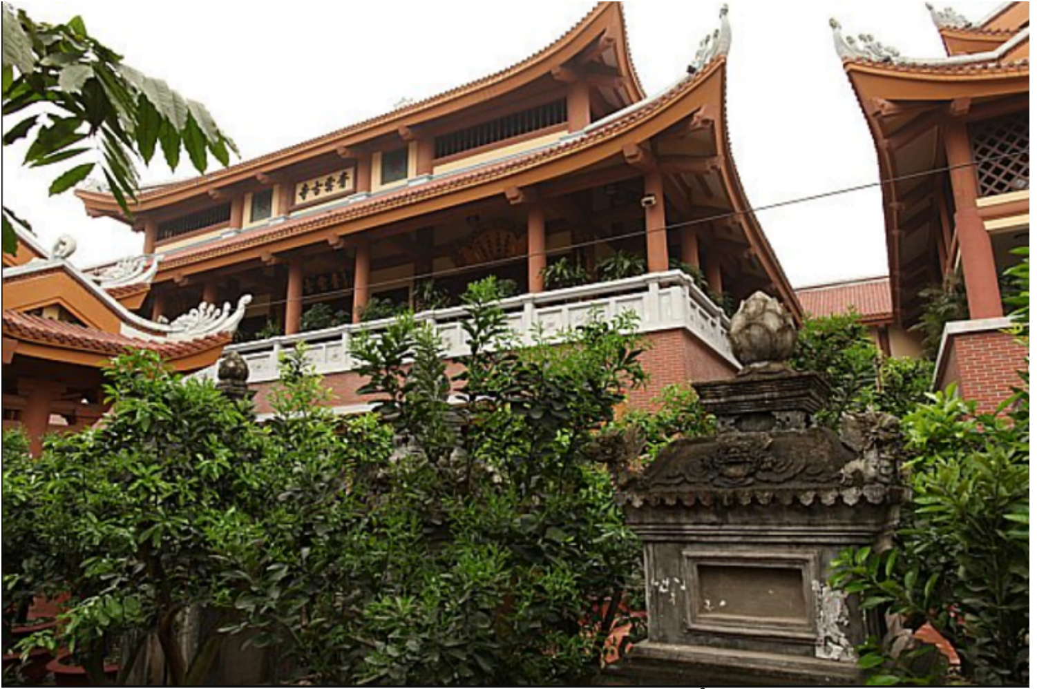
Chùa Yên Phú, huyện Thanh Trì, Hà Nội.