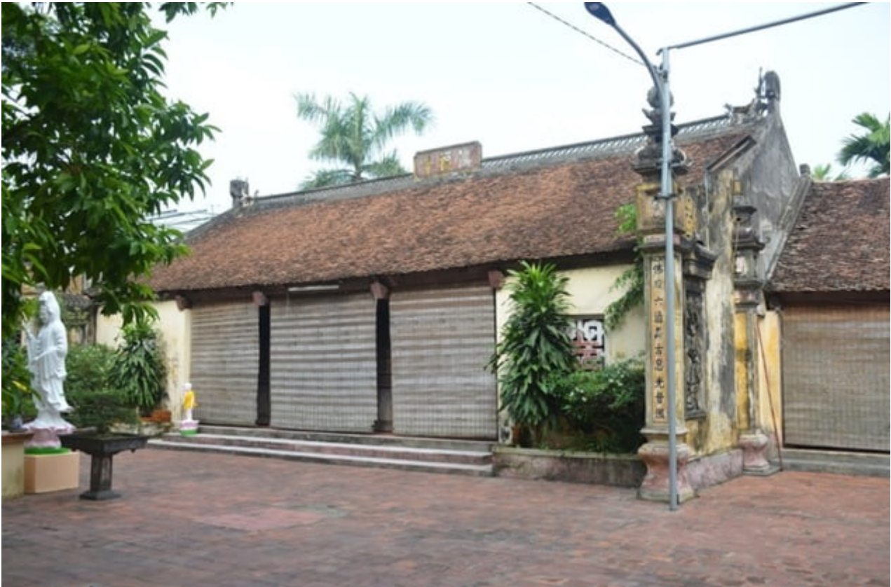
Phía trước tòa Tam bảo chùa Hồng Phúc