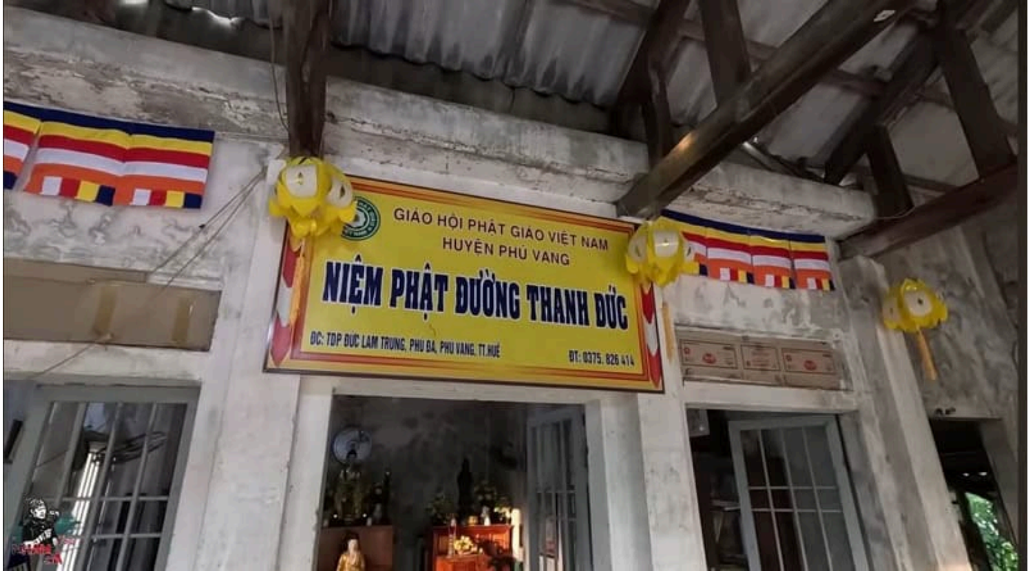
Mặt tiền chính điện chùa Thanh Đức

lam cổ kính, rêu phong và từng bước sẽ dung hết phước báu non trẻ cũng như tâm huyết tuổi trẻ để trùng tu lại ngôi Tam Bảo, đến đâu hay đến đó.