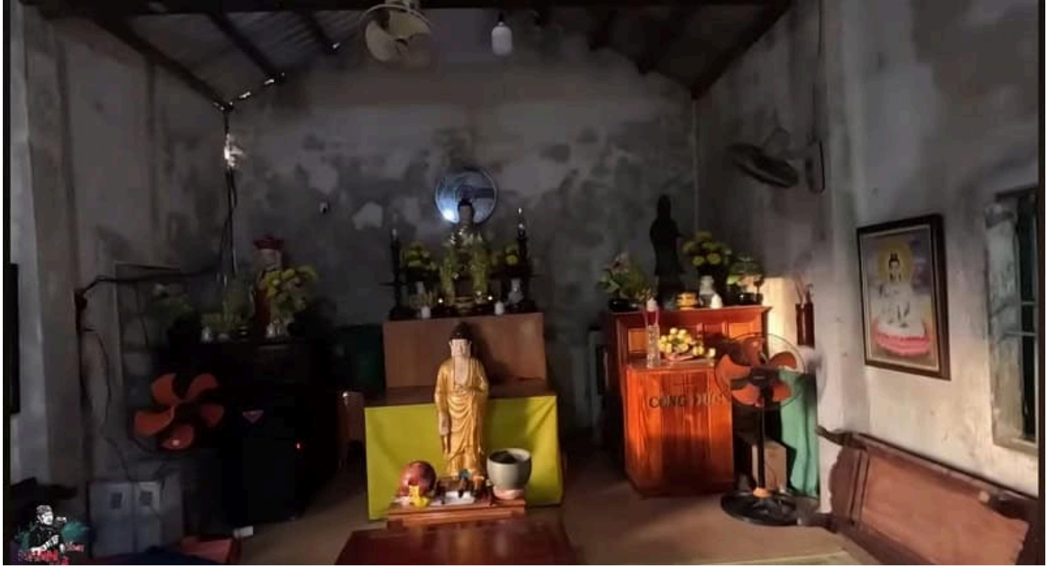
Chánh điện dột nát chùa Thanh Đức

Khi Ủy ban đã có trụ sở mới xây thì ngôi chùa lại được tiếp tục cho ngành giáo dục tạm sử dụng làm nơi dạy học. Hai tấm bảng dạy học hiện vẫn còn treo ở hai bên góc Chánh điện chùa. Vẫn chưa xong, sau khi cơ sở giáo dục có nơi dạy học mới thì ngôi chùa lại được trưng dụng làm tụ điểm họp tác xã và sau đó nữa là nhà kho.