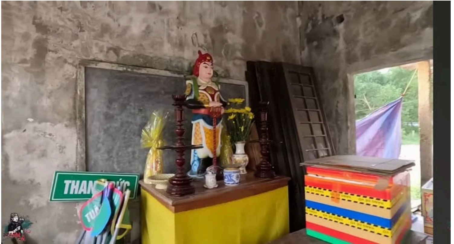
Một góc đờ của GDPT Thanh Đức