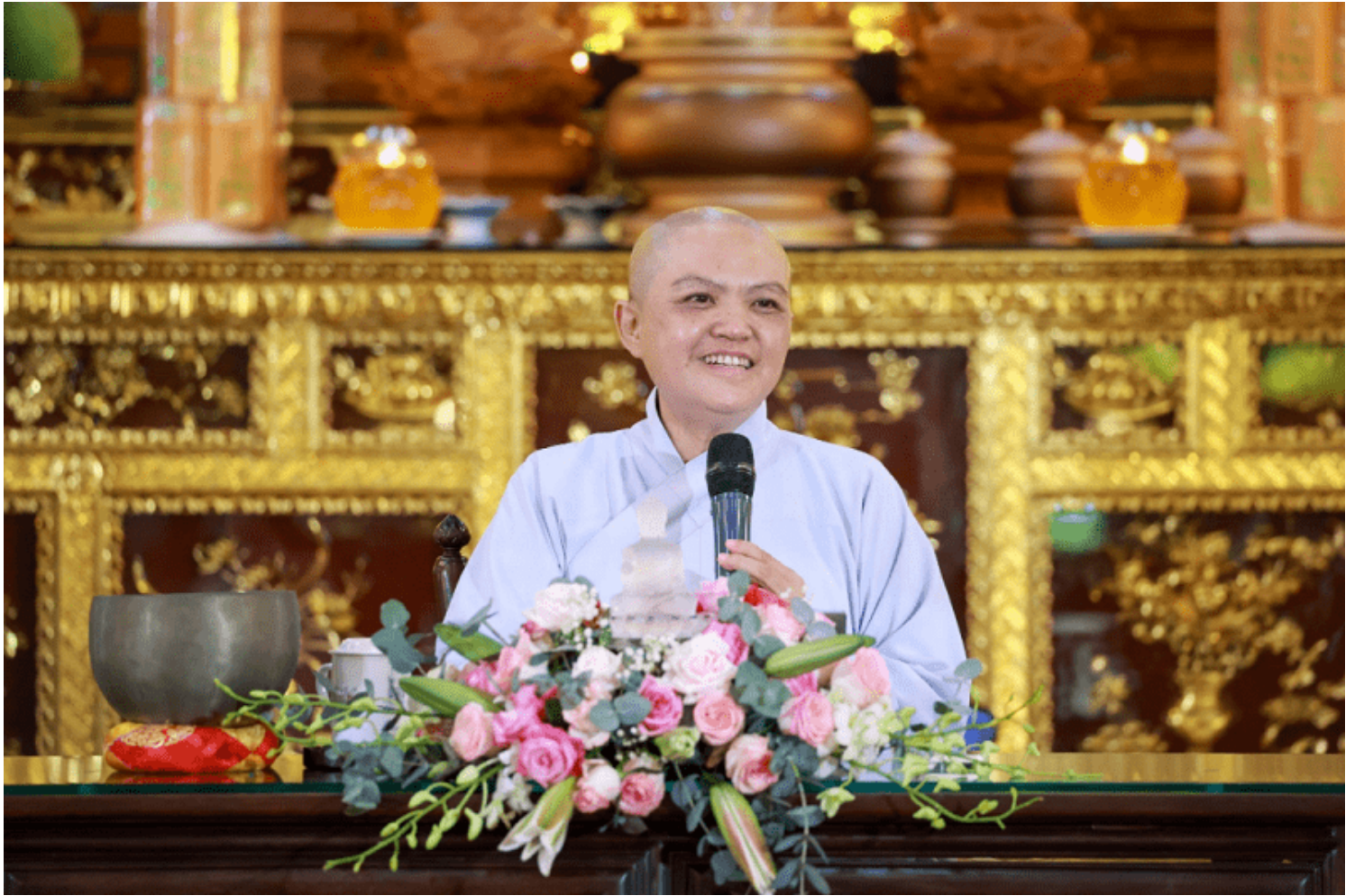
Ni sư Thích Nữ Hương Nhũ chia sẻ