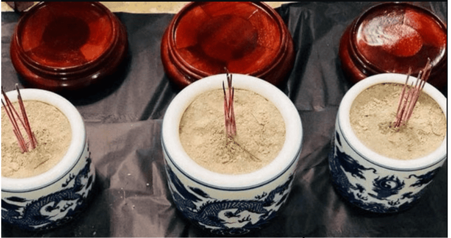
Hình ảnh chỉ mang tính chất minh họa.

mang tính tượng trưng cho ngũ phần hương (hương Giới, hương Định, hương Tuệ, hương Giải thoát và hương Giải thoát tri kiến). Dâng hương cúng dường là nguyện thành tựu năm phần tâm hương này.