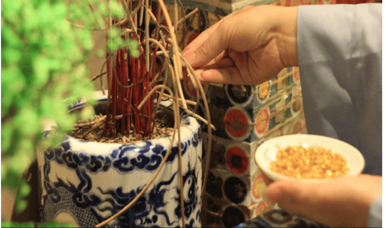
Hình ảnh chỉ mang tính chất minh họa.