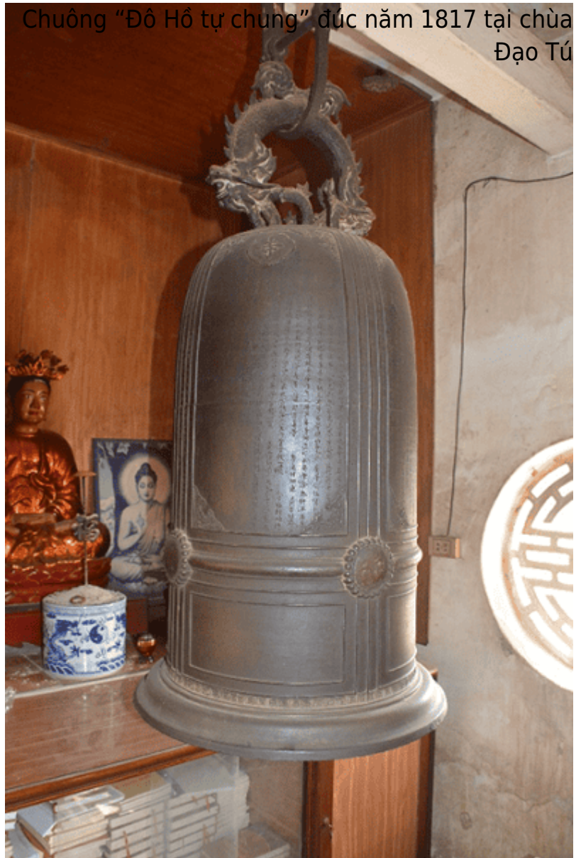
Chuông “Đô Hồ tự chung” đúc năm 1817 tại chùa Đạo Tú

Vai chuông hơi vuông, thân phình, miệng loe rộng, gờ miệng giạt cấp. Toàn thân chia làm 8 ô (4 trên, 4 dưới), ngăn cách giữa các ô là những đường chỉ nổi (gân chuông) gồm 5 đường ngang và 5 đường dọc, đường ở giữa to hơn hai đường bên cạnh. Xung quanh thân chuông (vị trí đường gân ngang) có 4 núm đánh đối xứng nhau hình tròn nổi cao, đường kính