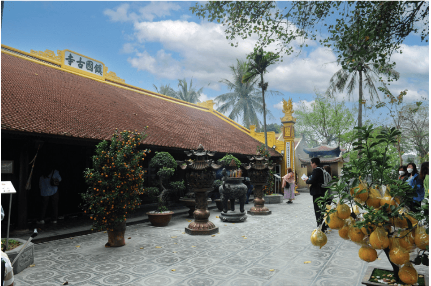
Chính điện chùa Trấn Quốc (Hà Nội)

Thông qua các khoá học ngắn hạn, trung bình thời gian từ hai đến ba tháng/ khóa, người phật tử sẽ tiếp cận và nắm chắc những kiến thức nền tảng, trang bị cho phật tử hiểu biết một cách chánh kiến, sâu sắc, đầy đủ nhất về đức Phật và đạo Phật.