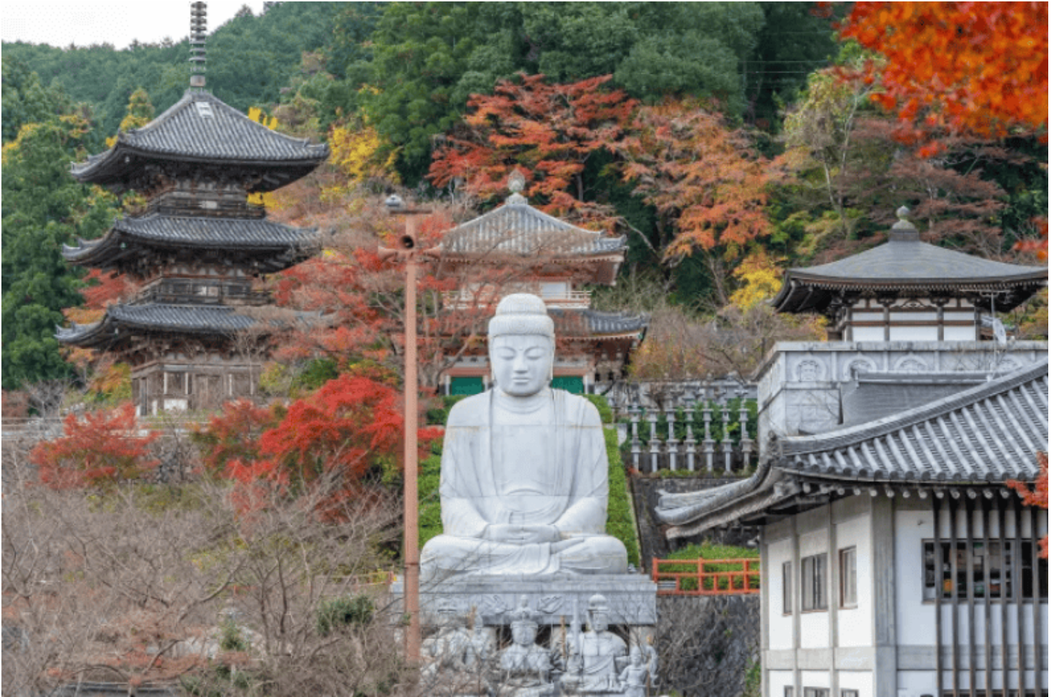
Hình ảnh chỉ mang tính chất minh họa.

Ở đây, không thể chỉ suy xét đến hình thức tổ chức bên ngoài của họ, còn phải tìm hiểu kỹ nội tại bên trong họ đã có những điểm nổi bật nào, những điểm đó đã có tác dụng tích cực gì đến tổ chức Tăng đoàn hiện đại, hoặc lớn hơn là cho sự phát triển của Phật pháp.