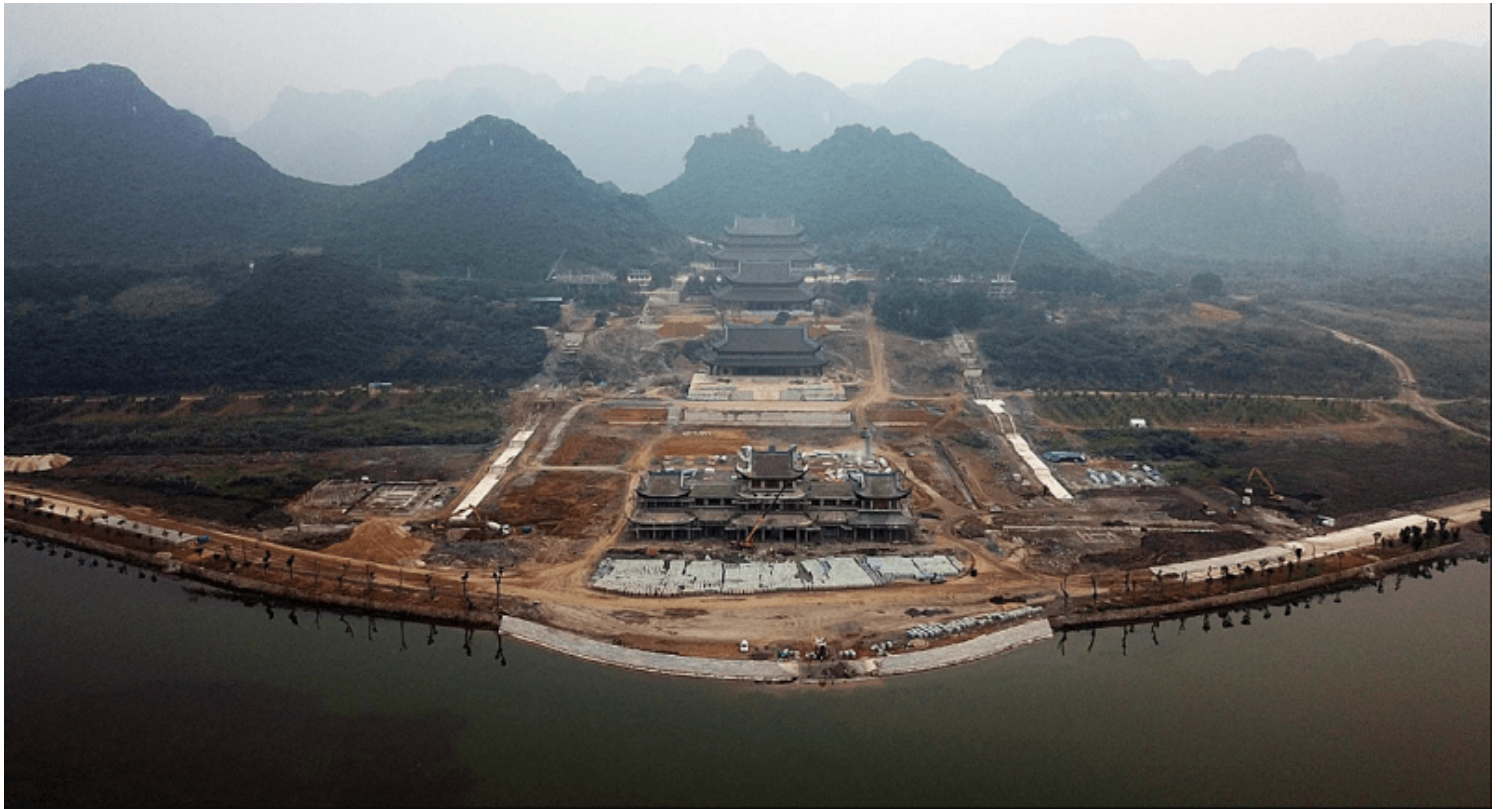
Tam Chúc - được coi là quần thể tâm linh lớn nhất thế giới tại Việt Nam-nơi sẽ diễn ra Đại lễ Vesak 2019 tại Ba Sao - Kim Bảng - Hà Nam.

Sự GIÁC NGỘ là tự thân mỗi người, không phụ thuộc vào cơ sở tôn giáo, không phụ thuộc vào tôn giáo.