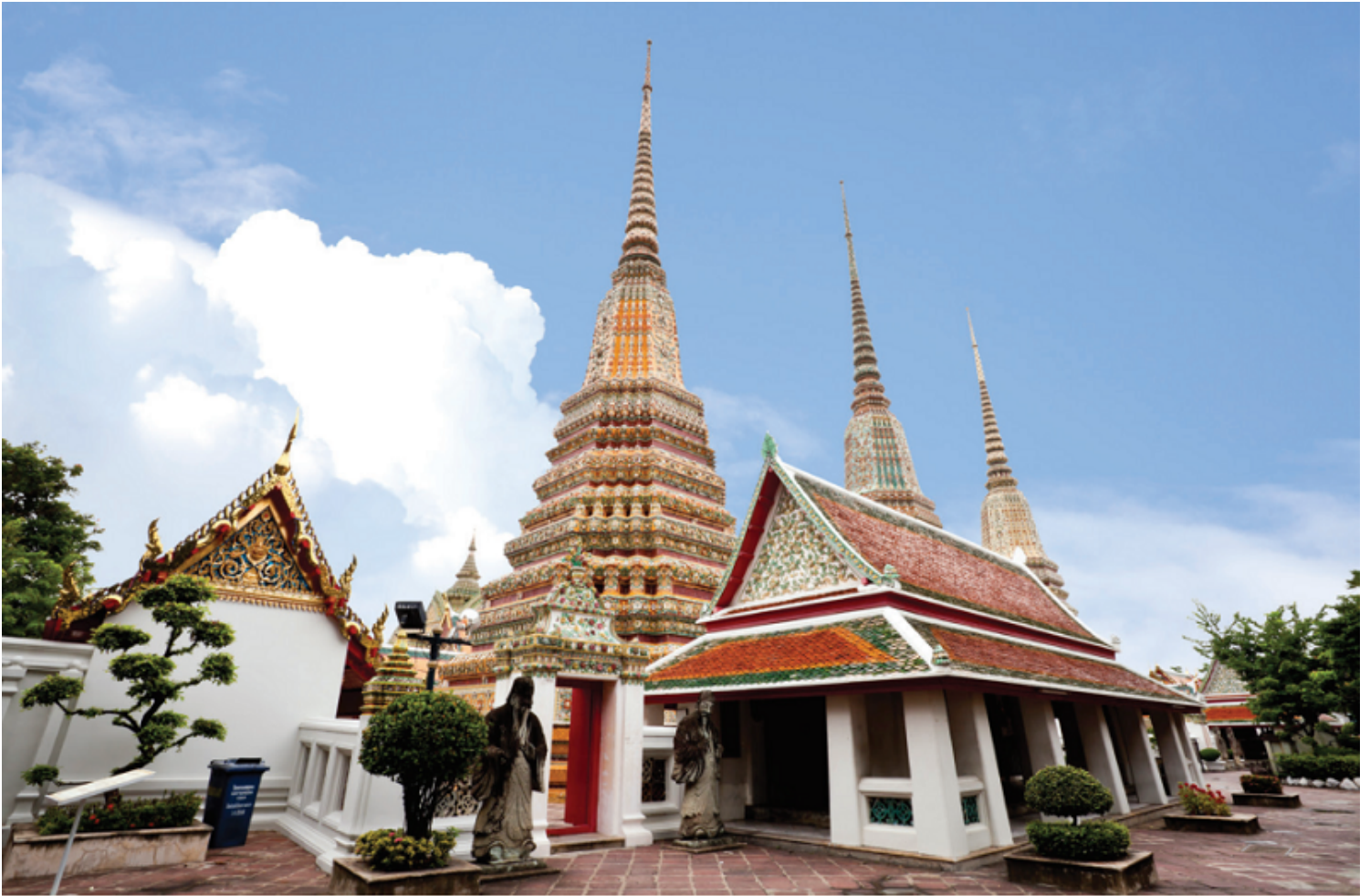
Chùa Wat Pho (Thái Lan)

Về phương diện lễ hội: Các lễ hội chịu ảnh hưởng của Phật giáo như lễ hội mừng năm mới của Campuchia; lễ hội Bun Phạ Vệt của Lào; lễ hội té nước Songkran của Thái Lan đã góp phần tạo nên diện mạo phong phú cho đời sống văn hóa ở các nước Đông Nam Á lục địa. Trước khi Phật giáo du nhập, Đông Nam Á chỉ có các lễ hội nông nghiệp, lễ hội mùa, lễ hội cầu mưa... nhưng khi có Phật giáo thì Phật giáo đã hòa vào lễ hội bản địa, trở thành hình thức sinh hoạt vừa mang tính giải trí, vừa mang tính tâm linh.