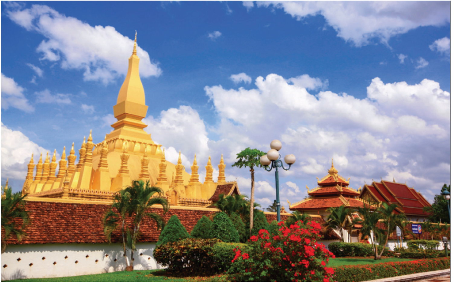
Chùa That Luang (Lào)