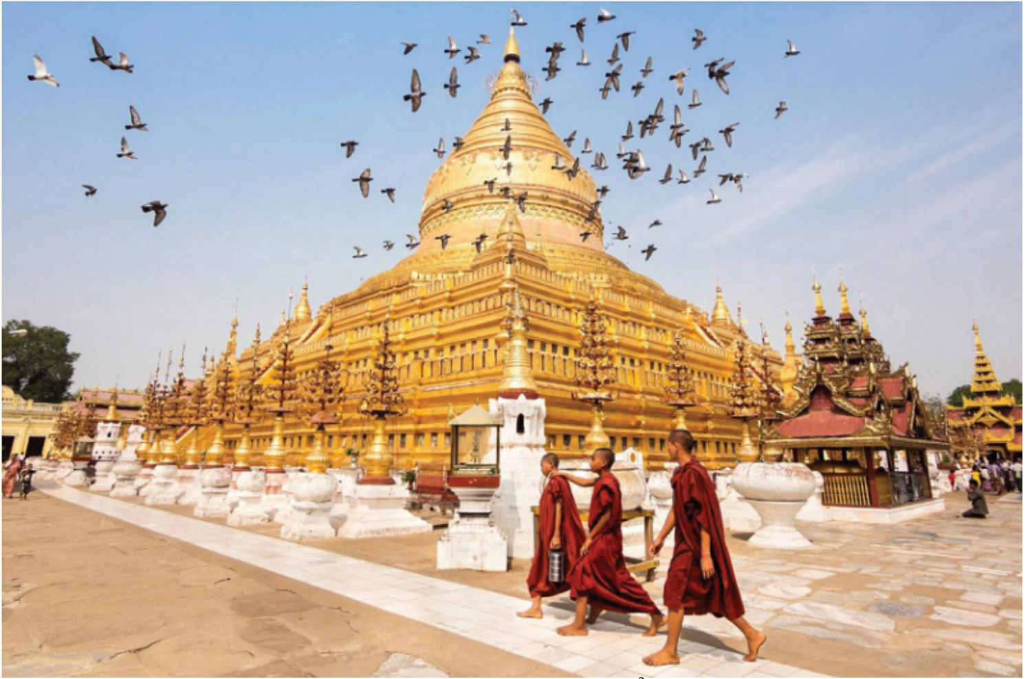
Chùa Shwedagon (Myanma)

Du khách khi đặt chân đến đây sẽ hiểu biết về một trong những triều đại huy hoàng nhất trong lịch sử Myanmar: triều đại Bagan (1044 - 1287). Vào thời kỳ rực rỡ nhất của mình (giữa thế kỷ 11 - thế kỷ 13), các nhà lãnh đạo Myanmar thời đó đã cho xây dựng hàng ngàn ngôi đền ở các vùng đồng bằng Bagan. Những đền, chùa được xây dựng trong thời đại này đánh dấu sự khởi đầu của truyền thống Phật giáo mới ở Myanmar.