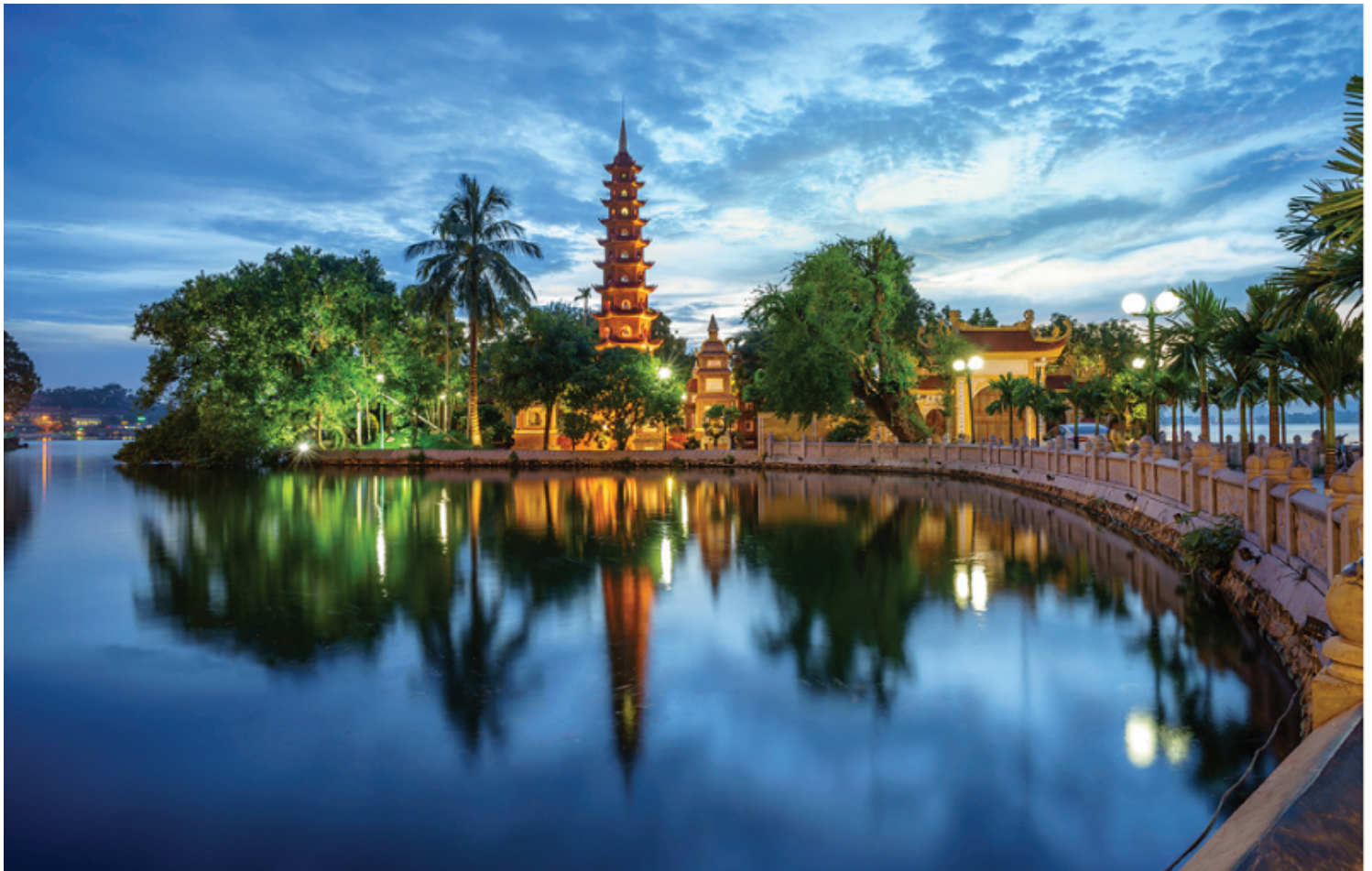
Chùa Trấn Quốc (Việt Nam)

Angkor Thom: Được vua Jayavacmar VII khởi công xây dựng vào thế kỷ thứ XII. Sức hấp dẫn của đền này nằm ở tháp Bayon, Bayon là biểu tượng cho sức mạnh nội sinh của người dân Campuchia.