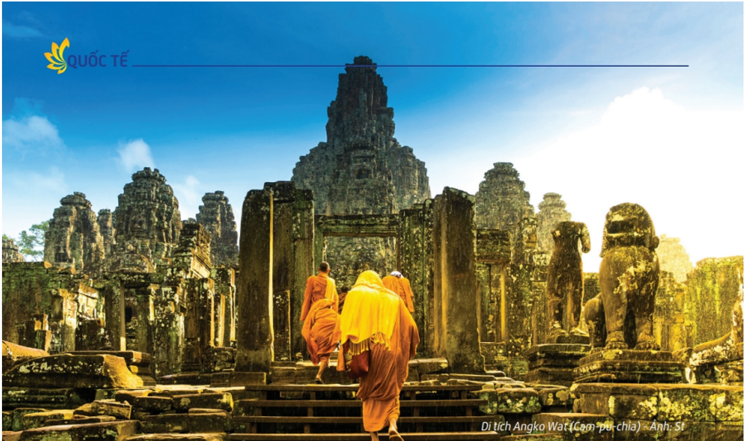
Di tích Angko Wat (Cam-pu-chia)