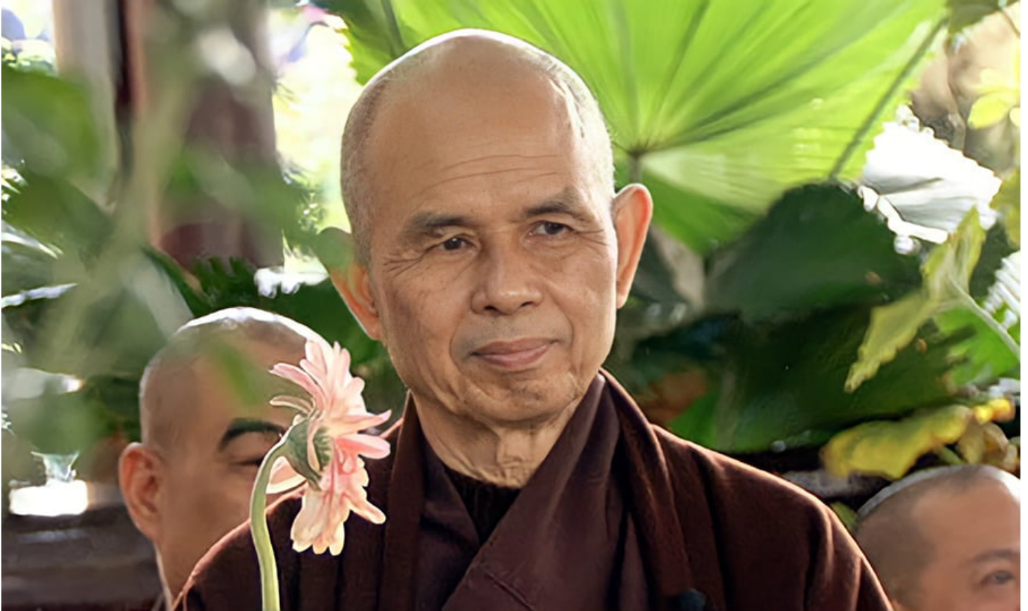
Thiền sư Thích Nhất Hạnh.

Một số nhà quan sát có thể kết nối Phật giáo và đặc biệt là việc tu tập thiền định Phật giáo, thiền định giúp thành tựu tâm lý hoặc hướng nội của “sự an tâm” thường gắn liền với cực lạc và hạnh phúc. Tuy nhiên, nhiều người cho rằng truyền thống Phật giáo, với sự hùng dũng để nhận chân thật những nỗi khổ niềm đau và tươi mát trong suối nguồn từ bi tâm, đã có động lực mạnh mẽ để tích cực tham gia vào các cuộc đấu tranh bất bạo động nhằm kiến tạo hoà bình thế giới. Mạch nguồn của kết nối xã hội Phật giáo này được gọi là “Đạo Phật nhập thế” – Phật giáo tích cực tham gia vào các mối quan hệ xã hội với sự phát triển, tiến bộ của xã hội.