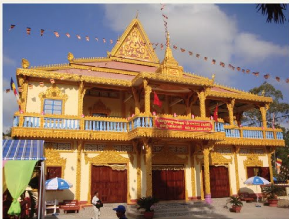
Chùa Thnol Chum, Thủy Liễu, ấp Hòa An, xã Thủy Liễu, huyện Gò Quao