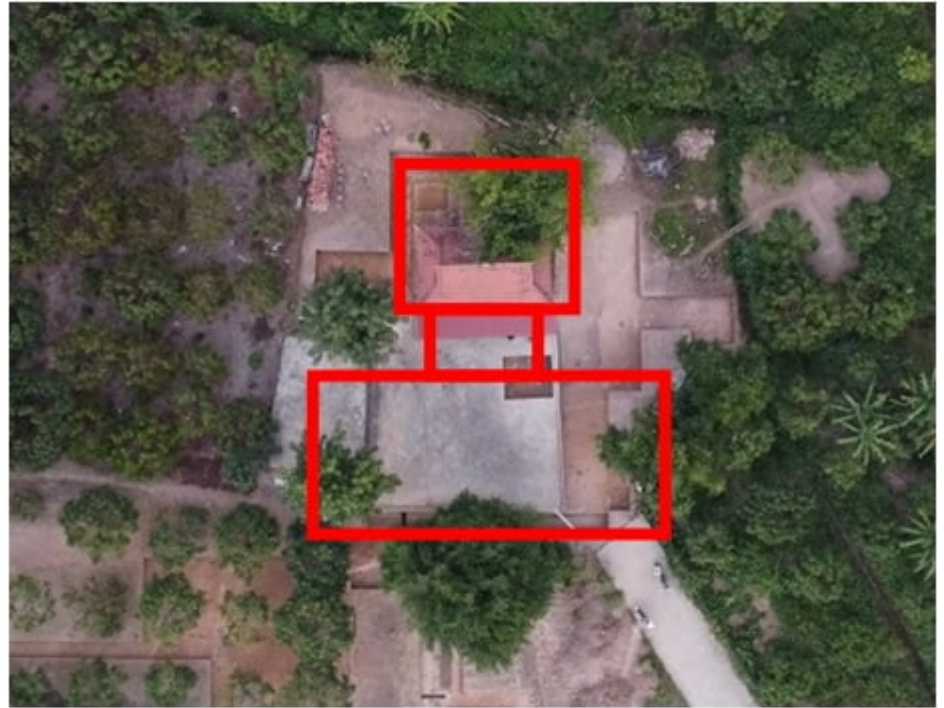
Phác dựng kiến trúc hình chữ công chùa Đám Trì thời Trần dựa trên các dấu vết đã xuất lộ tại H1, H2 và H5