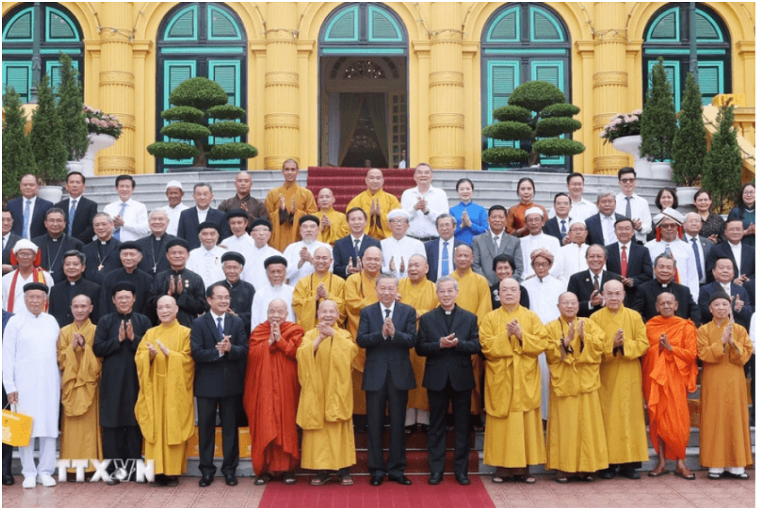
Chủ tịch nước Tô Lâm chụp ảnh cùng lãnh đạo chức sắc các tôn giáo ngày 13/06/2024 tại Phủ Chủ tịch.

Nguyên tắc chính niệm và nhận thức về thời điểm hiện tại là những yếu tố cốt lõi trong triết lý Phật giáo Việt Nam. Chúng không chỉ giúp người tu hành đạt được sự giải thoát mà còn giúp người thường sống một cuộc sống an lành, hạnh phúc hơn. Trong bối cảnh hiện đại, việc áp dụng những nguyên tắc này càng trở nên quan trọng để duy trì sức khỏe tinh thần và cảm nhận sâu sắc về ý nghĩa của cuộc sống.