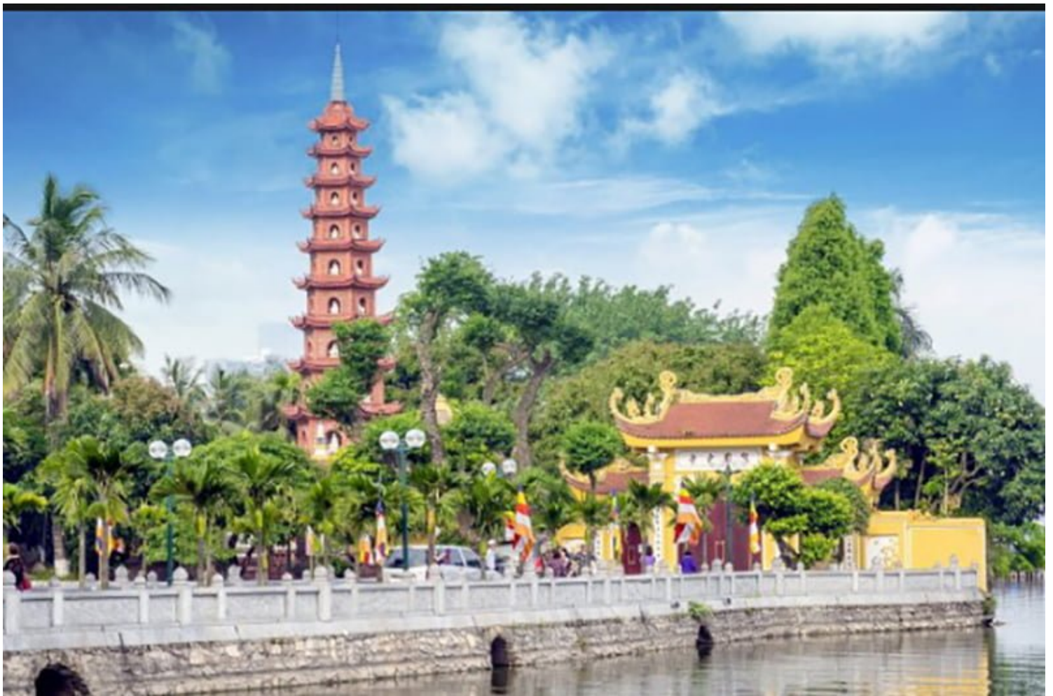
Chùa Trấn Quốc

Chùa Trấn Quốc là một trong những ngôi chùa cổ nhất ở Hà Nội và Việt Nam, nằm trên một bán đảo phía Nam của Hồ Tây, ở gần cuối đường Thanh Niên, quận Ba Đình, Hà Nội. Từng là trung tâm Phật giáo của kinh thành Thăng Long vào thời Lý và thời Trần với những giá trị về lịch sử và kiến trúc, chùa Trấn Quốc nổi tiếng là chốn cửa Phật linh thiêng, là điểm thu hút rất nhiều tín đồ Phật tử, khách tham quan, du lịch trong và ngoài nước.