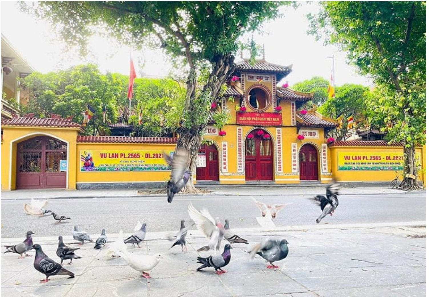
Tam quan chùa Quán Sứ.