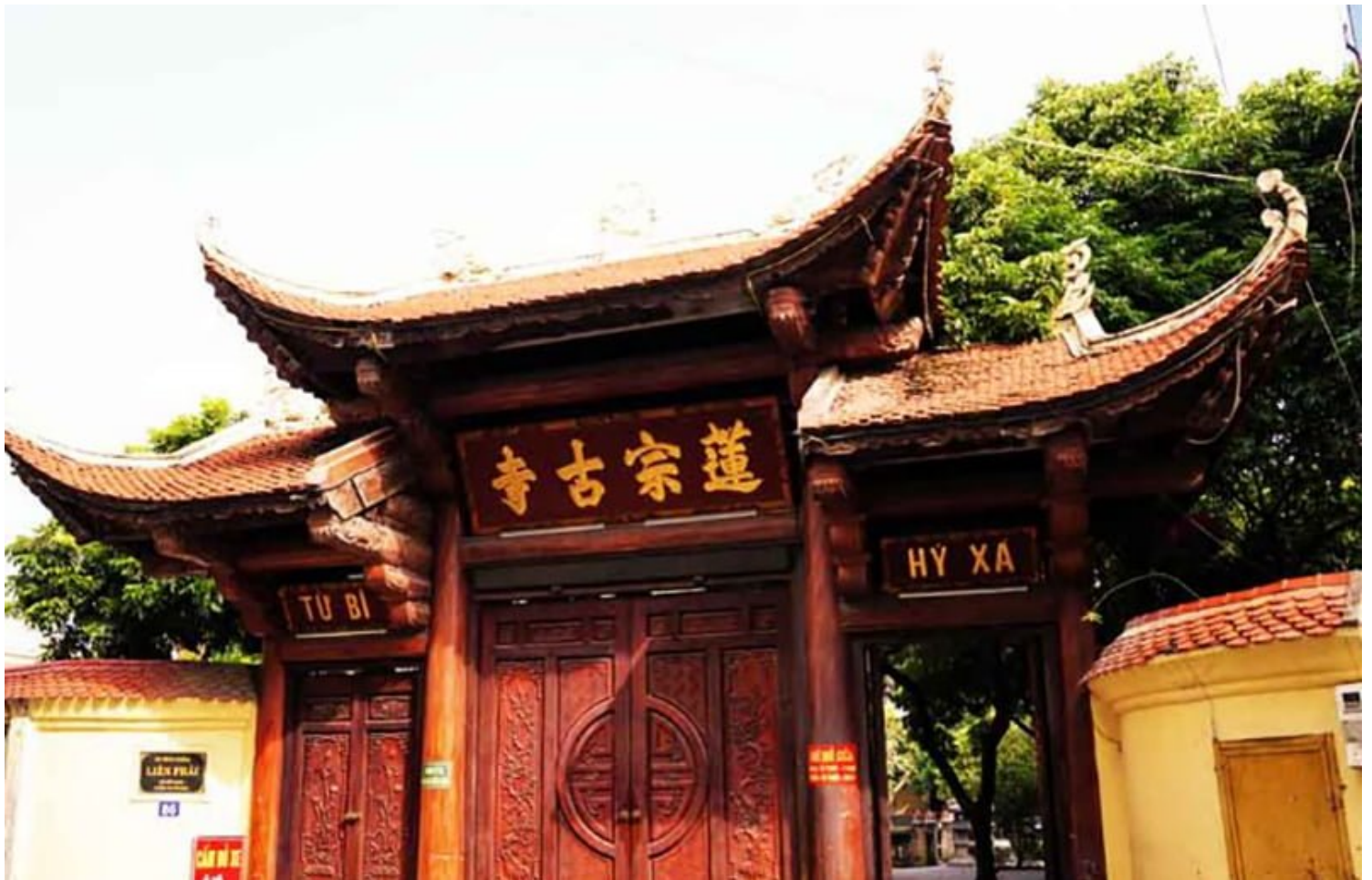
Chùa Liên Phái.

Chùa Liên Phái có địa chỉ tại phố Bạch Mai, phường Cầu Dền, quận Hai Bà Trưng, thành phố Hà Nội. Chùa do Lâm Giác Thượng sĩ thuộc Thiền phái Lâm Tế lập vào năm 1726, đời Vua Lê Dụ Tông. Thời vua Lê Dụ Tông (1705 - 1729) chùa có tên là Liên Hoa, đến năm 1733, chùa đổi tên là Liên Tông. Năm 1841, vì phải kiêng tên Nguyễn Phúc Miên Tông của vua Thiệu Trị nên chùa đổi tên là Liên Phái. Trên cổng ngõ ở bên tay phải số nhà 182, phố Bạch Mai có đề tên chùa bằng cả chữ Hán lẫn Quốc ngữ.