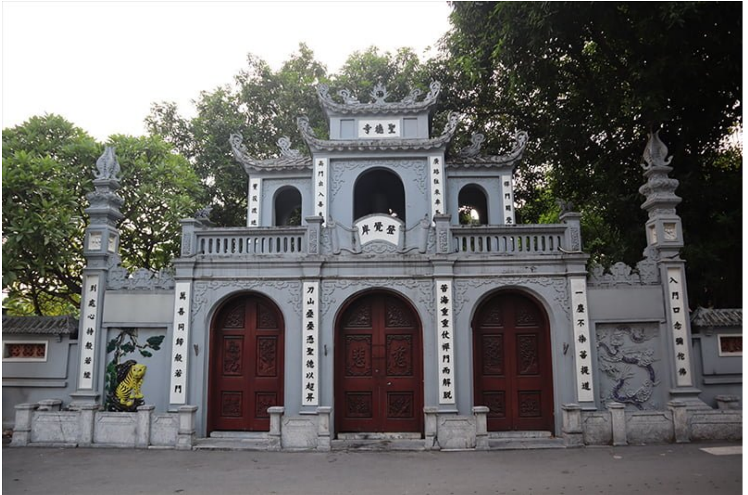
Tam quan chùa Hà.

Truyền thuyết thứ hai: Chùa Hà được xây dựng lên để vua Lê Thánh Tông (trị vì 1460-1497) bày tỏ lòng nhớ ơn các đại thần Nguyễn Trãi, Nguyễn Xí, Đinh Liệt đã cứu mang mình và phế bỏ Lê Nghi Dân để đưa mình lên ngôi vua vào năm 1460.