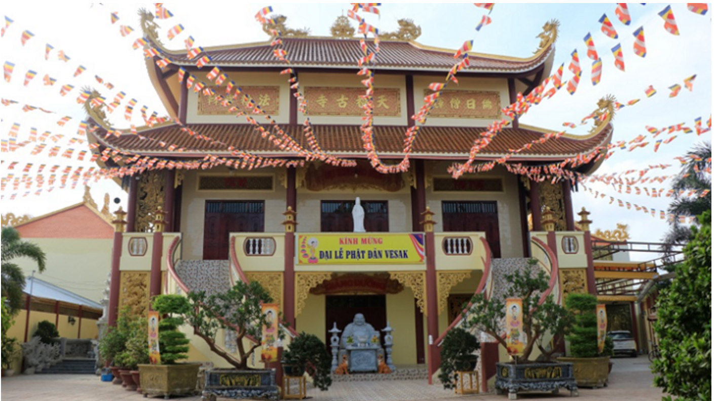
Chính điện chùa Thiên Phước