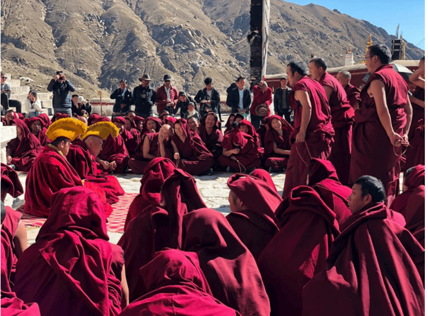
Tranh biện tại một ngôi chùa ở Tây Tạng

Tôi không tới Tây Tạng để tìm kiếm những cuộc thiền hành. Nhưng Tây Tạng quả thật là một vùng đất khiến chúng ta mang đầy một cảm xúc thật khó tả khiến gợi nhớ đến tác phẩm “ Thiên táng ”, lời của nhân vật Trác Mã: “ Trên vùng cao nguyên, bầu trời có thể thay đổi, con người ta có thể thay đổi, bò cừu, hoa cỏ đều có thể thay đổi, song các ngọn núi thiêng thì không ”. Có những không gian, mấy trăm năm, vẫn giữ tinh thần riêng biệt.