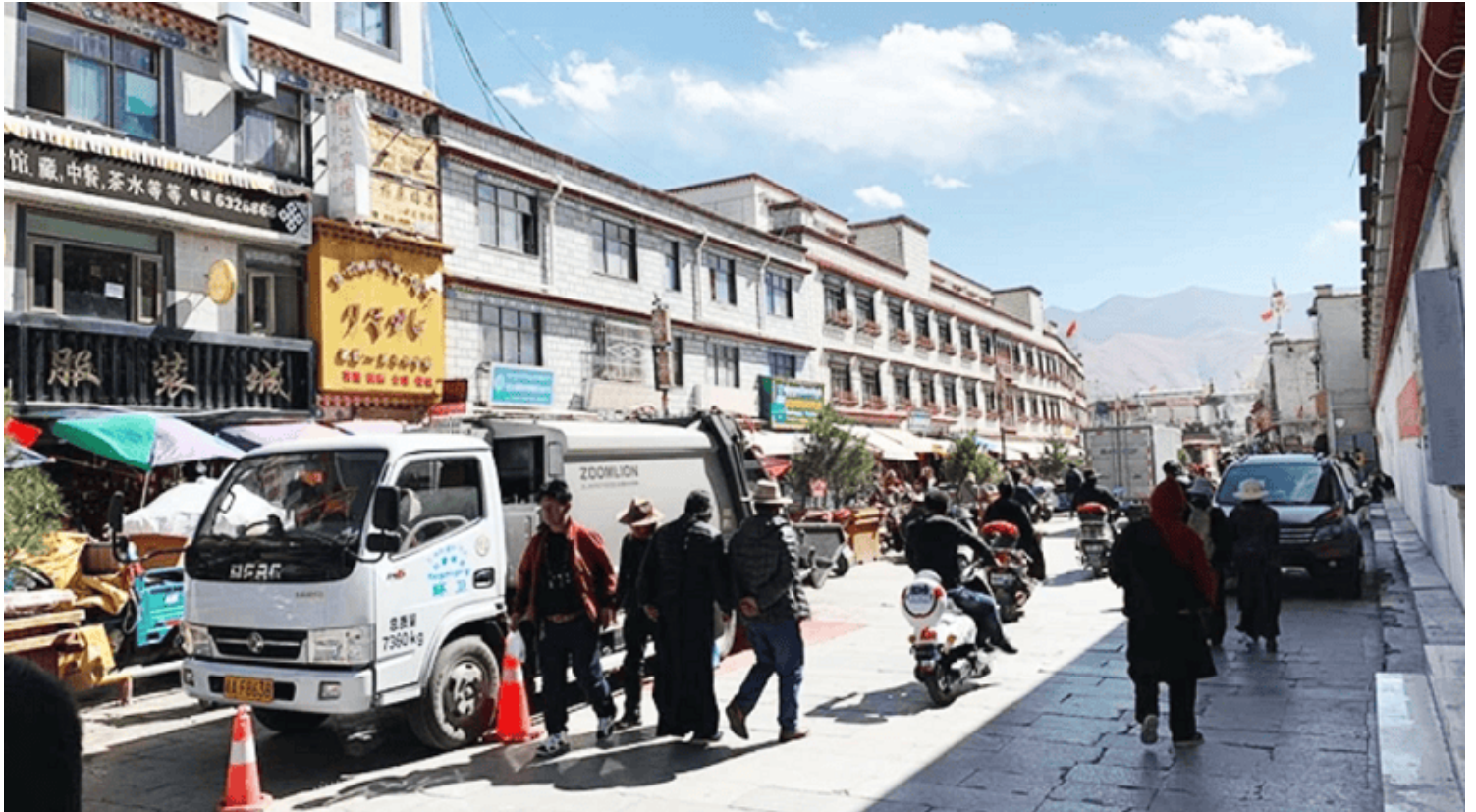
Một góc Lhasa