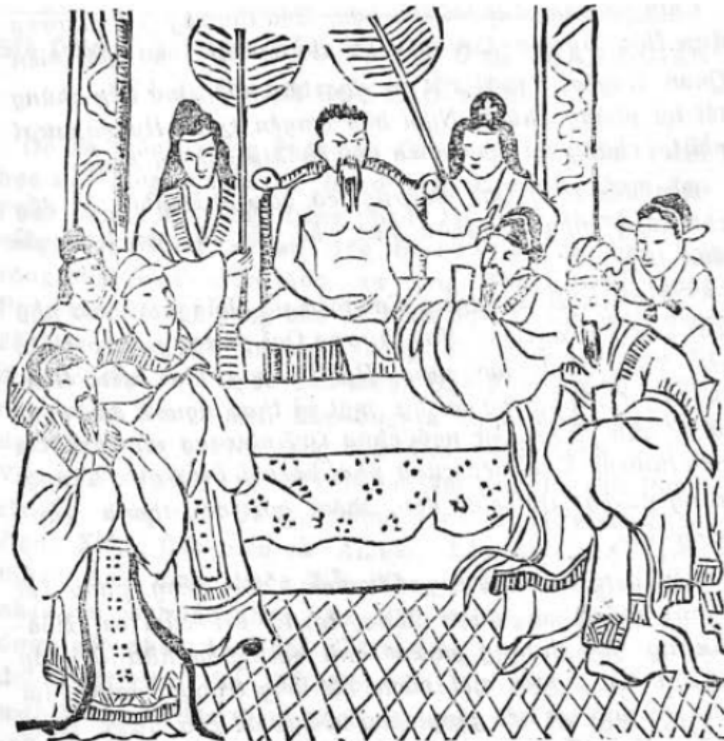
TỈNH RỒI, THỬ XEM NGƯỜI ĐANG ĐIỀN

Vua nói rằng “các người chớ vội lo, ta tự khắc có thuốc chữa ngay”. Vua nói xong liền đi vào trong, uống một chén nước mưa độc ác rồi đi ra, tức thì cũng hóa rồ như mọi người. Mọi người thấy thế đều mừng rỡ nói rằng: “may thay! May làm thay vua ta bây giờ không hóa rồ nữa rồi ạ”.