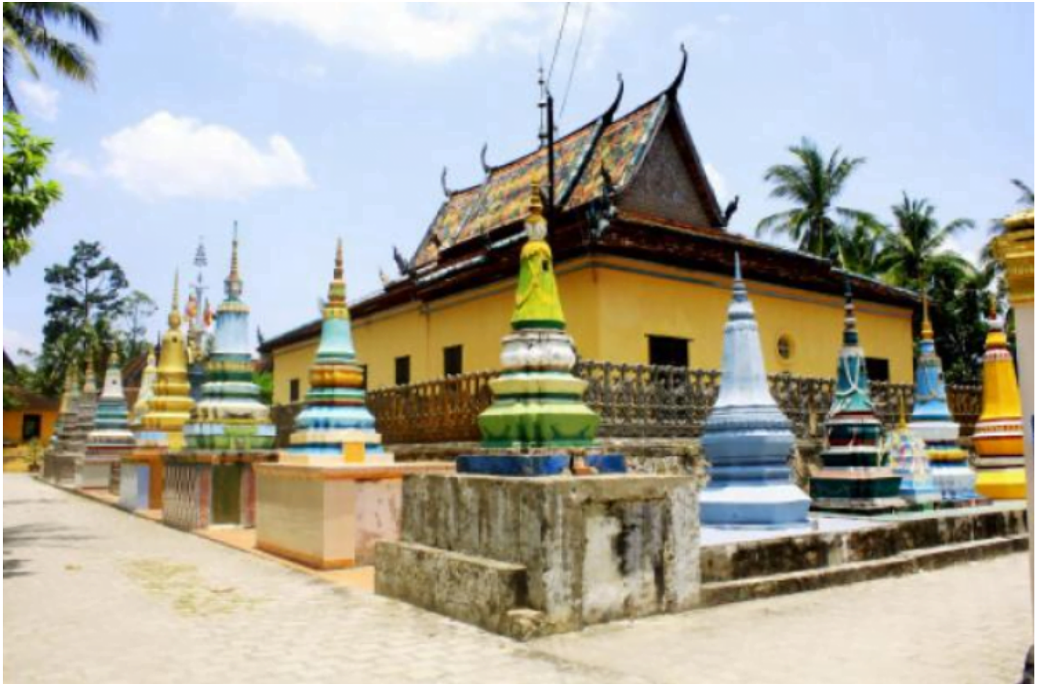
Hình ảnh chỉ mang tính chất minh họa.

Nhưng hầu hết tất cả đều được nhận thưởng không nhiều thì ít, sư nói đó là phần thưởng của sự ham học mặc dù điểm số của các bạn ấy không cao. Đêm hôm ấy vui biết chừng nào, tất cả các sư trong chùa hội họp đông đủ còn có các phật tử xa gần.