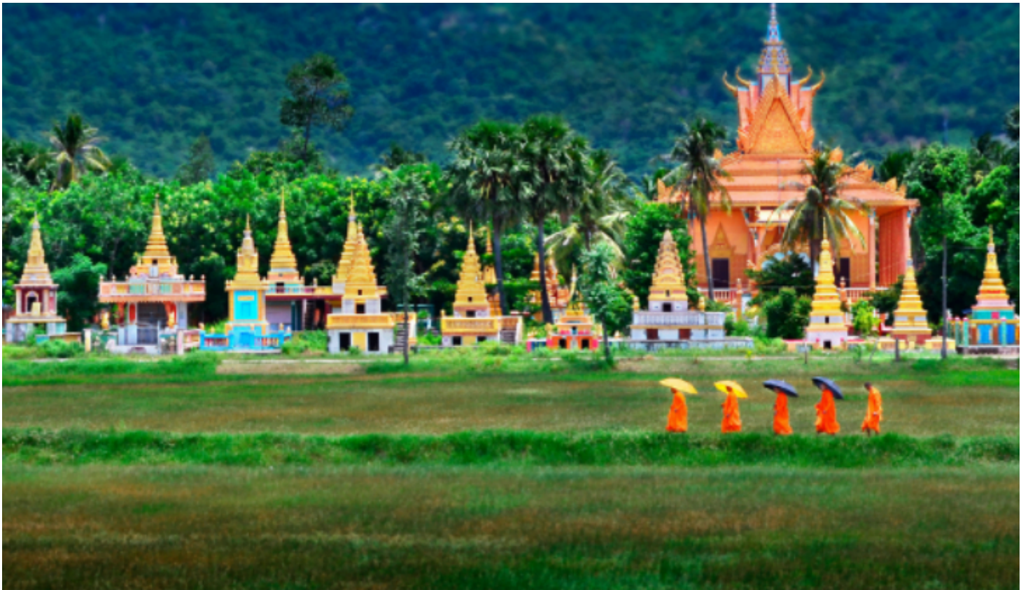
Hình ảnh chỉ mang tính chất minh họa.

Có hôm được sư cả lên lớp chúng tôi như tự biết mình, chẳng đứa nào giở trò ma lanh nữa mà khép nép vâng lời một cách lạ lùng. Tôi nhìn chăm chăm vào chiếc y trên người sư, một màu vàng tươi tắn như có một mảnh lực nào đó khiến tôi cứ dán mắt vào nó thật lâu. Một sự ấm áp thật lạ lắm làm sao.