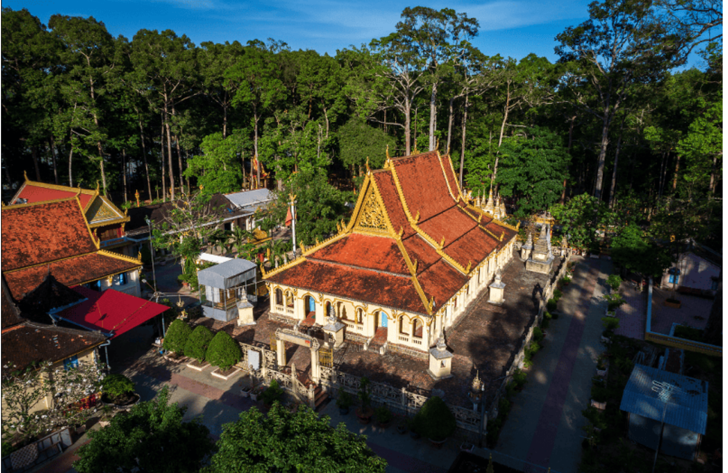
Hình ảnh chỉ mang tính chất minh họa.

Giờ này mới hơn bảy giờ, ông Lục đã chấp tác xong buổi sáng trở bước về phòng để học kinh, vị sư nào đảm trách việc dạy chữ thì chuẩn bị sách vở để lên lớp. Lớp học bắt đầu trong mùa hè, khi đó các em học sinh đã kết thúc chương trình học ở trường sẽ quay sang học chữ Khmer ở chùa. Chỉ những ngày Rằm và ngày cuối tháng các em được nghỉ nhưng có đứa vẫn theo ba mẹ đem cơm vào chùa chứ chẳng chịu ở nhà.