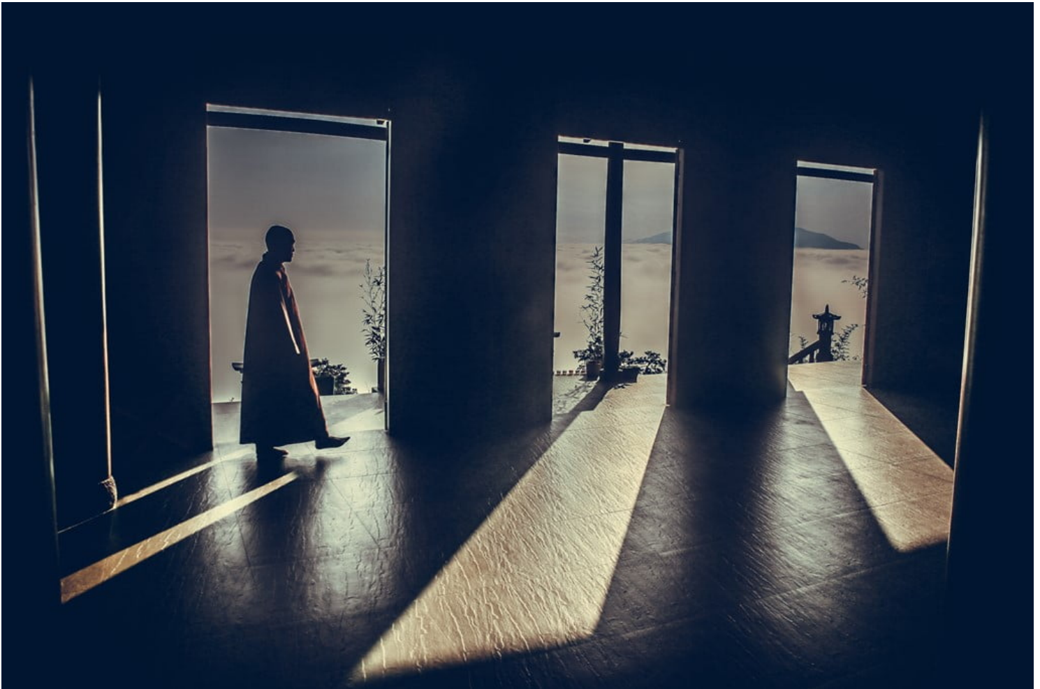
Hình ảnh chỉ mang tính chất minh họa.

Sự có mặt những gì trên hành tinh đang tồn tại dù tốt hay xấu, đều là điều tất yếu của hiện thể nghiệp thức biểu hiện. Đã là nghiệp thức tất không đồng nhất; do căn cơ bất đồng mà sản sinh những phụ thể bất đồng.