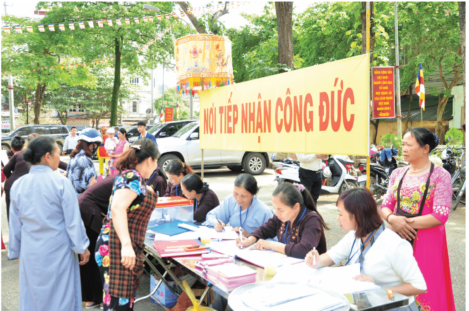
Nghĩ về hai chữ “công” và “đức” của hòm “công đức” (Ảnh: Minh Nam)

Điều này có vẻ nghịch lý với những ngôi chùa không có bóng dáng của hòm công đức, thì người đến chùa không có “công” và có “đức” hay sao? Chùa Tiêu (thị xã Từ Sơn, tỉnh Bắc Ninh), chùa Hội Xá (xã Thăng Lợi, huyện Thường Tín, Hà Nội), chùa Bà Nành (phố Nguyễn Khuyến, Đống Đa, Hà Nội) v.v... là một trong những ngôi chùa đặc biệt mà hàng chục năm qua chưa từng có bất kỳ một hòm công đức nào. Sư thầy trụ trì chùa Tiêu quan niệm “là người có tâm thì đến cổng chùa, Phật đã biết. Tại sao cứ phải đặt tiền lên trước mặt Phật như vậy?” Có lẽ, trong xã hội hiện đại này, điều đặc biệt như vậy thật khó lòng tin được, nhưng nó đang hiện hữu thực sự.