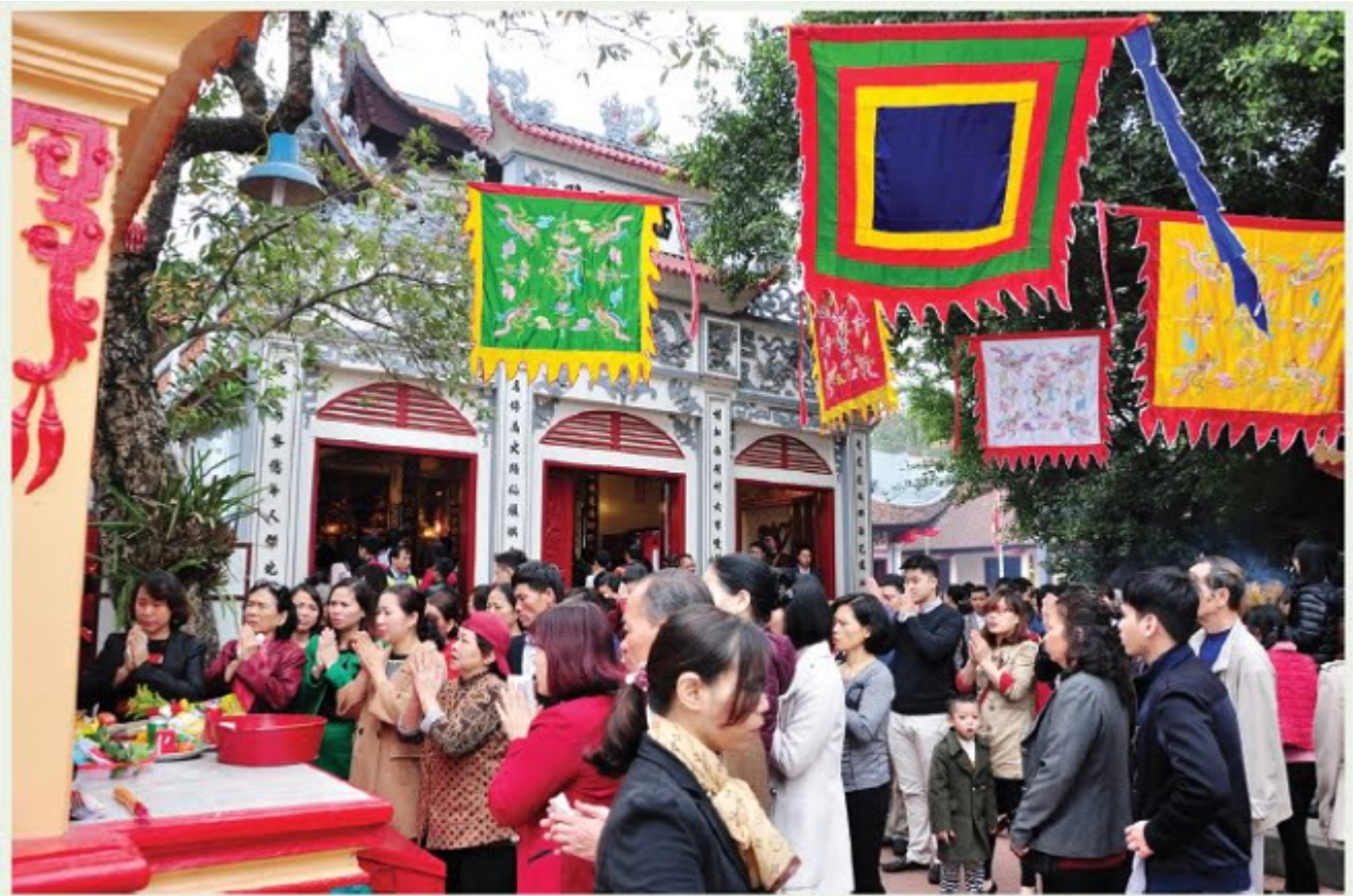
Lễ Phủ Tây Hồ

Đạo Phật vốn hướng con người đến sự bình an, thanh tịnh và “lộc chùa” chỉ là phương tiện để hóa độ chúng sinh, tạo duyên thiện lành cho mỗi người tham dự lễ hội góp phần xây dựng và phát triển thiện tâm. Nhưng vì tâm lý đám đông, người ta giật mình cũng giật, sợ tới mình sẽ mất phần nên ngay giữa chốn thiền môn trang nghiêm đã xuất hiện những cảnh “cướp lộc” vô cùng phản cảm. Hành động này xuất phát từ lòng tham và sự ích kỷ của con người. Ai cũng tham có “lộc”, muốn bản thân có được nhiều “lộc” mà đang tâm chèn ép, dẫm đạp lên nhau. Thật đáng thương thay?!