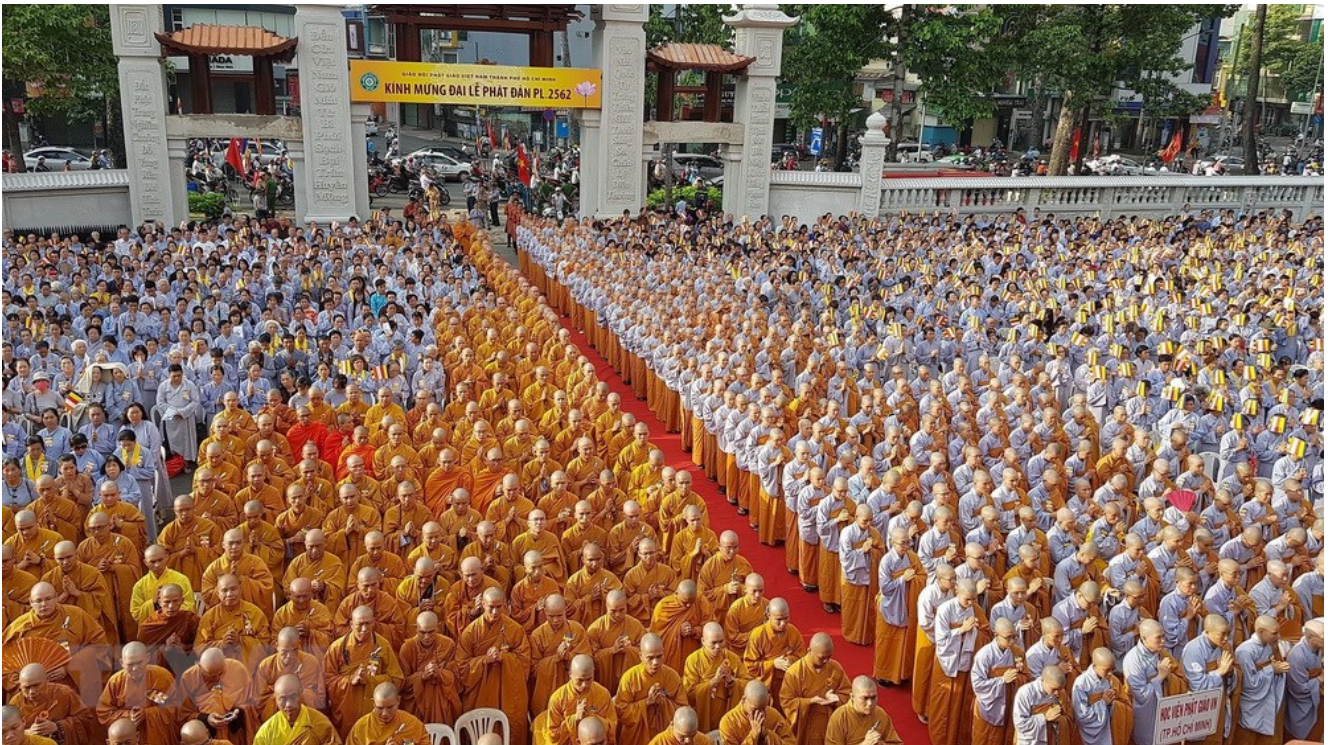
Đồng đảo tăng ni, phật tử của thành phố tham dự Đại lễ Phật đản Phật lịch 2562.

Có thể nói, trên phương diện tổ chức và hoạt động, trải qua 8 nhiệm kỳ, hơn 40 năm Giáo hội đã không ngừng phát triển, không chệch hướng với phương châm Đạo Pháp - Dân tộc - Chủ nghĩa xã hội, khẳng định được vị trí của GHPG VN trong lòng dân tộc, đất nước, cũng như hội nhập trên trường quốc tế. Giáo hội đã tham gia nhiều hoạt động quốc tế Phật giáo, như tham gia tổ chức Châu Á vì hòa bình (ABCP), thành viên sáng lập thượng đỉnh Phật giáo thế giới, thành viên Vesak của Liên hợp quốc, 3 lần đăng cai tổ chức thành công Phật Đản Liên hợp quốc... Tuy nhiên, các cấp Giáo hội cũng còn những bất cập, khuyết điểm, về mặt nội lực chưa mạnh và sự quản lý chưa chặt chẽ. Ở đây chúng tôi xin phép được nêu ra mấy vấn đề: